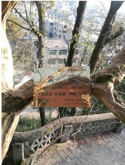
被挂牌的紫薇古树