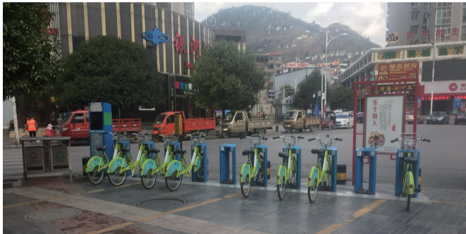
位于新天地的公共自行车点,已有两辆车被租出去,但无法归还。

本报讯(文/图 记者 高智)自安顺有公共自行车以来,方便了市民出行,也促进了低碳生活的发展。公共自行车的使用率非常高,市民们纷纷点赞叫好。