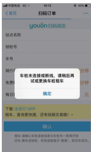
支付宝扫描显示无法租车