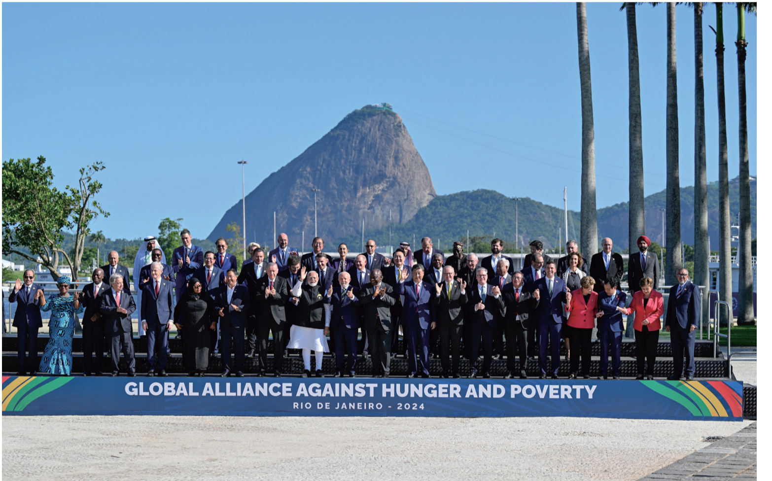
当地时间11月18日上午，国家主席习近平在巴西里约热内卢出席二十国集团领导人第十九次峰会。峰会把“构建公正的世界和可持续发展的星球”作为主题，并决定成立“抗击饥饿与贫困全球联盟”。这是习近平同与会领导人共同参加巴方发起的“抗击饥饿与贫困全球联盟”合影。

新华社里约热内卢11月18日电 当地时间11月18日上午，国家主席习近平在巴西里约热内卢出席二十国集团领导人第十九次峰会。 在峰会第一阶段围绕“抗击饥饿与贫困”议题讨论时，习近平发表题为《建设一个共同发展的公正世界》的重要讲话。(全文另发) 习近平指出，当今世界百年变局加速演进，人类发展面临的机遇和挑战前所未有。作为世界主要大国领导人，我们应该不畏浮云遮望眼，秉持命运共同体意识，扛起历史责任，展现历史主动，推动历史进步。中国主办二十国集团领导人杭州峰会时，首次将发展议题放到宏观经济政策协调的中心位置，这次里约热内卢峰会把“构建公正的世界和可持续发展的星球”作为主题，并决定成立“抗击饥饿与贫困全球联盟”。从杭州到里约热内卢，我们都致力于同一个目标，即建设一个共同发展的公正世界。 为了建设这样的世界，我们要在贸易投资、发展合作等领域增加资源投入、做强发展机构，多一些合作桥梁，少一些“小院高墙”，让越来越多发展中国家过上好日子、实现现代化；要支持发展中国家采取可持续的生产和生活方式，妥善应对气候变化、生物多样性丧失、环境污染等挑战，建设生态文明，实现人与自然和谐共生；要营造开放、包容、非歧视的国际经济合作