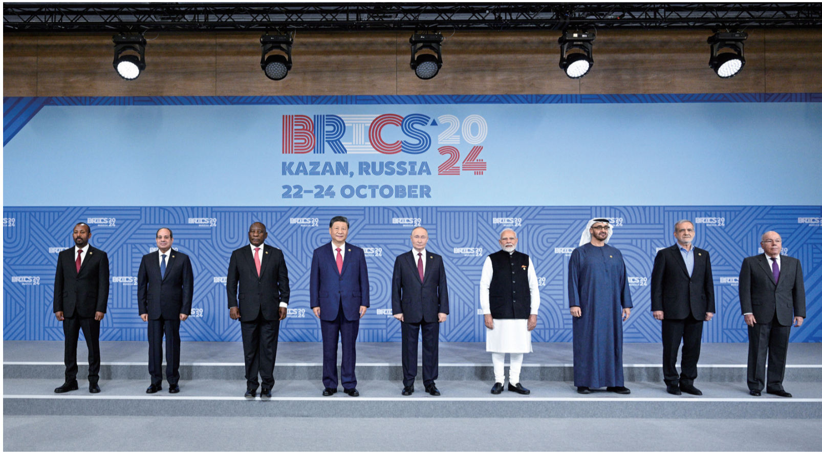
当地时间10月23日上午，金砖国家领导人第十六次会晤在喀山会展中心举行。俄罗斯总统普京主持会晤。中国国家主席习近平、巴西总统卢拉（线上）、埃及总统塞西、埃塞俄比亚总理阿比、印度总理莫迪、伊朗总统佩泽希齐扬、南非总统拉马福萨、阿联酋总统穆罕默德等出席。这是会晤期间，金砖国家领导人集体合影。