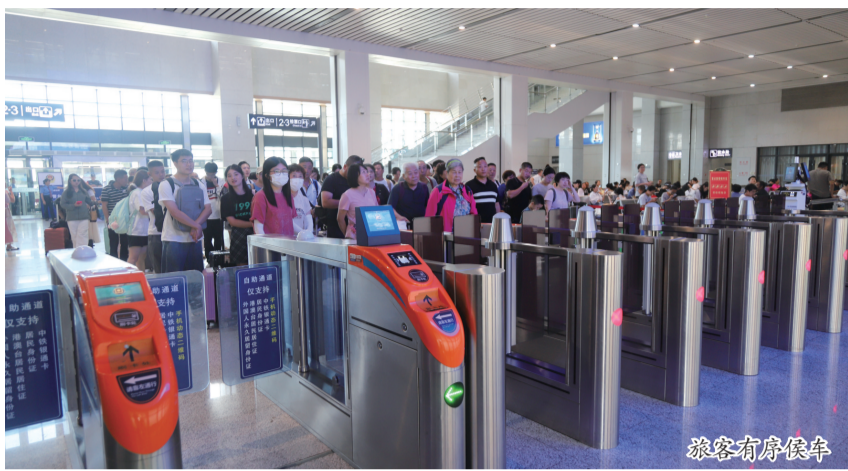
扩大运输能力。同时,进一步完善服务措施,优化站内便捷换乘通道,不断提升

据介绍,今年暑运,乘坐铁路动车到安旅游、品尝美食的游客较多,加之学生放假、探亲回安等旅客叠加,铁路客流持续高位运行。安顺西站合理调整运力供给,优化运力配置,采取加开列车等措施