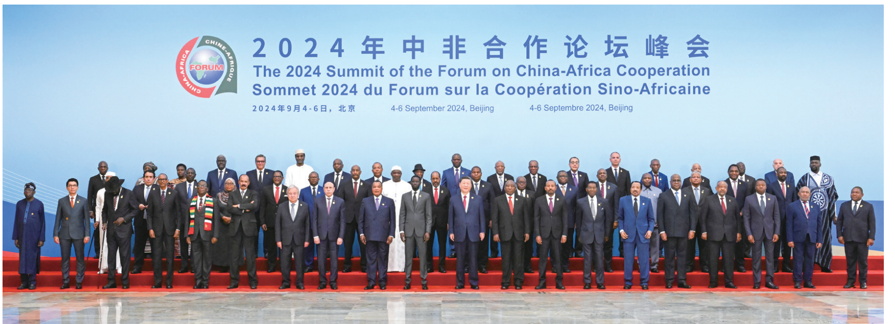
9月5日上午，国家主席习近平在北京人民大会堂出席中非合作论坛北京峰会开幕式并发表主旨讲话。这是开幕式前，习近平同出席峰会的外方领导人集体合影。

新华社北京9月5日电 9月5日上午，国家主席习近平在北京人民大会堂出席中非合作论坛北京峰会开幕式并发表主旨讲话。习近平宣布，中国同所有非洲建交国的双边关系提升到战略关系层面，中非关系整体定位提升至新时代全天候中非命运共同体，将实施中非携手推进现代化十大伙伴行动。 中共中央政治局常委李强、赵乐际、王沪宁、蔡奇、丁薛祥、李希出席。 初秋北京，高远澄明。天安门广场和长安街两侧，鲜艳的五星红旗同53个非洲国家和非洲联盟旗帜迎风飘扬。 习近平同出席峰会的51位非洲国家元首、政府首脑以及2位总统代表、非盟委员会主席和联合国秘书长集体合影。 在《和平—命运共同体》乐曲和热烈掌声中，习近平同外方领导人共同步入会场，在主席台就座。 习近平发表题为《携手推进现代化，共筑命运共同体》的主旨讲话。 习近平首先代表中国政府和中国人民对出席峰会的外方嘉宾表示热烈欢迎。 习近平指出，在这收获的季节，很高兴同各位新老朋友相聚北京，共商新时代中非友好合作大计。中非友好穿越时空、跨越山海、薪火相传。中非合作论坛成立24年来特别是新时代以来，中国同非洲兄弟姐妹们本着真诚友谊、守望相助、同舟共济、手拉手、心连心，坚定捍卫彼此正当权益；在经济全球化大潮中同舟共济、共担风雨，在应对全球性挑战中携手并肩、共克时艰，在维护世界和平稳定中相互支持、彼此支持，树立了新型国际关系的典范。经过近70年辛勤耕耘，中非关系正处于历史最好时期。面向未来，中方愿同非洲国家一道，共同推进现代化，共筑命运共同体。 习近平指出，实现现代化是世界各国不可剥夺的权利。中国正坚定不移以中国式现代化全面推进强国建设、民族复兴伟业。非洲也正朝着非盟《2063年议程》描绘的现代化目标稳步