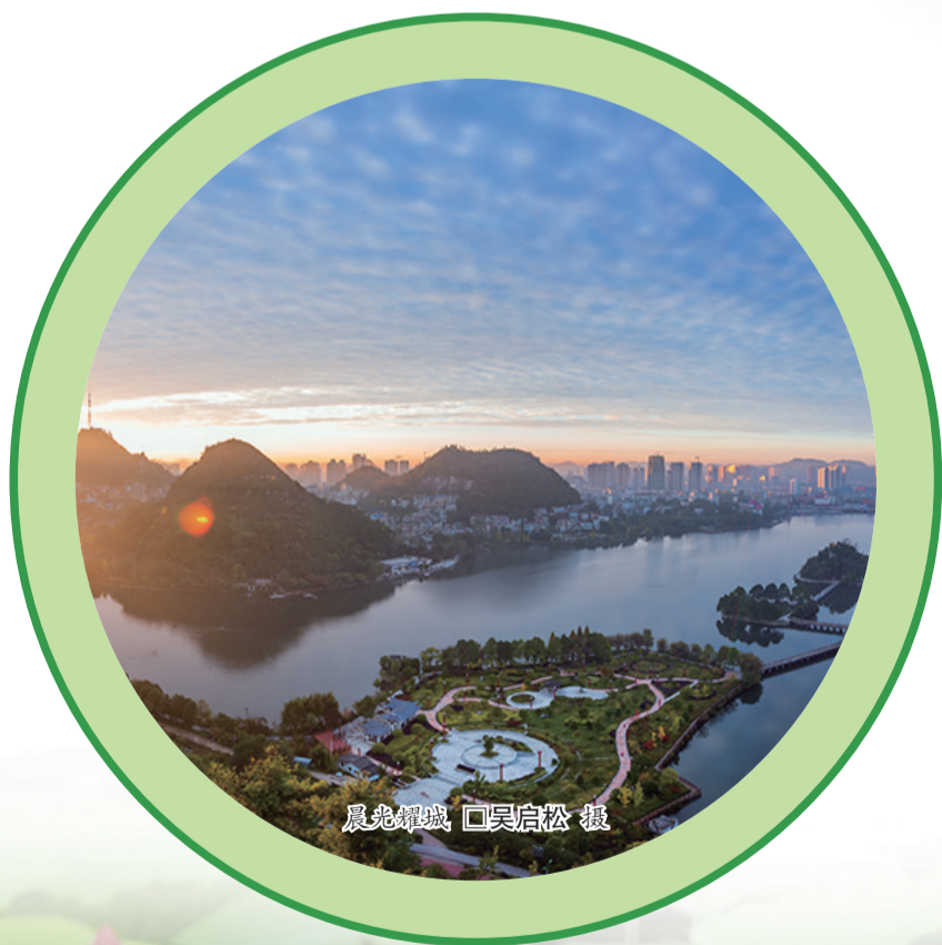
晨龙湖城 □吴启松 摄