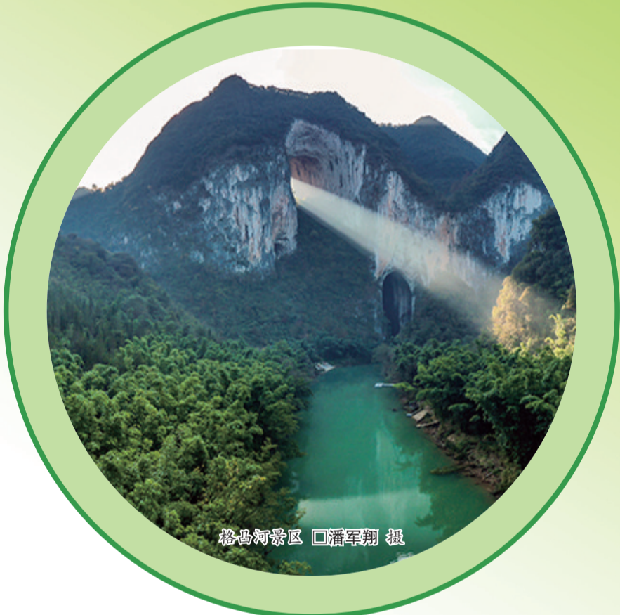
格母河景区