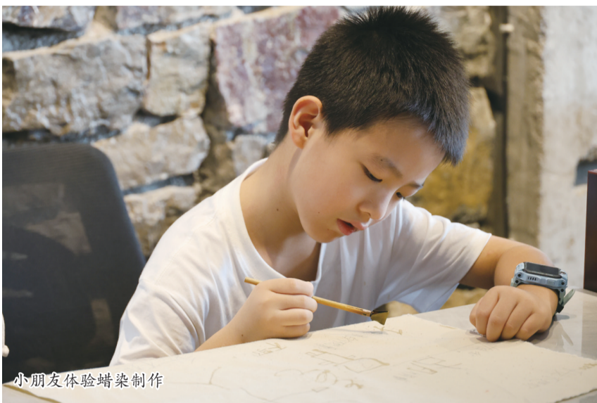
小朋友体验蜡染制作

一个被绿水青山环抱的村落。位于安顺经开区么铺镇的牛蹄关村，不仅自然风光旖旎，更蕴藏着丰富的文化底蕴。眼下正值旅游旺季，村里迎来了不少远道而来的客人，让这座静谧的村落焕发出勃勃生机。而古老技艺与现代生活的交融，更是成为了乡村振兴路上的一抹亮丽风景线。