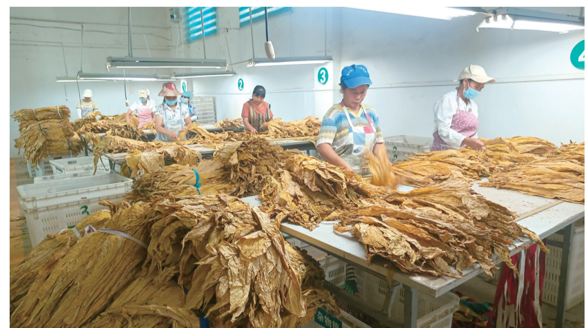
8月19日,在紫云自治县猫营镇烟叶收购站分选车间,数十名工人正按照烟叶的长度、色泽、厚薄等进行分选,每个环节井然有序。据了解,该收购站从8月12日开始收购烟叶,截至目前,已收购干烟叶2万余斤。预计今年能收购干烟叶38万斤。

初秋时节,西秀区鲍家屯村田园、小溪与村落相映成趣,成为游客休闲游玩的好去处。