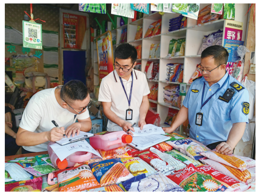
今年以来,市农业农村局联合市场监管、公安、法院、检察院等相关部门,开展“净网”专项整治行动,确保全市粮食生产和重要农产品稳产保供。图为执法人员依法没收伪劣农资。

推进健全完善医保基金安全监管机制,探索“线上+线下”的监管手段,不断完善“智慧监管+社会监管”模式。全市创新开展打击欺诈骗保维护基金安全暨医保普法宣传教育工作站建设,健全完善了医保基金监管联席会议、综合监管协同工作机制及行刑衔接工作机制,调整充实了医保基金安全监管专家库及社会监督员队伍,全市建设医保普法宣传工作站51个,入库专家240名,聘请社会监督员78人。2024年以来,全市检查定点医疗机构597家,依法依规处理79家,追回医保基金和处以违约金1114.89万元(其中违约金139.13万元),2023年智能审核拒付医保基金88万余元。