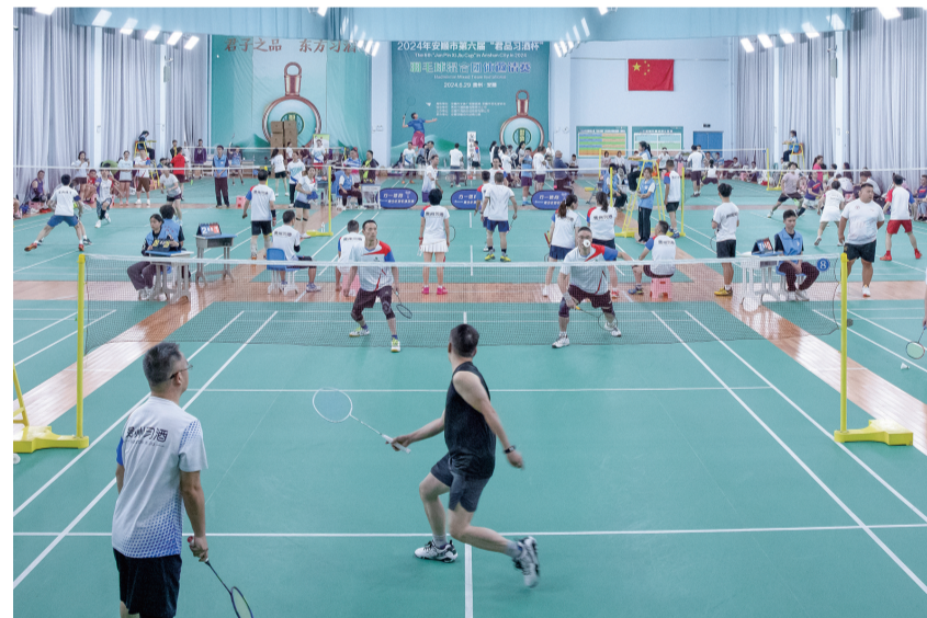
6月29日,2024年安顺市第六届“君品习酒杯”羽毛球混合团体邀请赛在双阳小学羽毛球馆开赛,来自全省各市州的20支队伍上百人参加比赛。