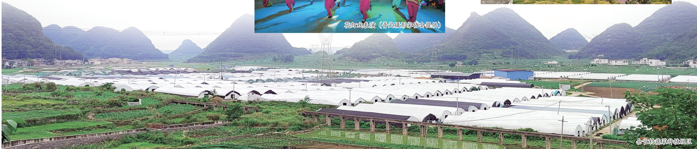
余官村蔬菜种植园区