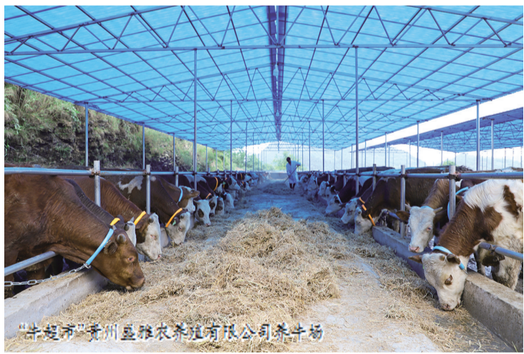
“牛起”贵州益隆农牧业有限公司养牛场

通过坚持以高质量党建引领保障高质量发展,该镇农业产业稳步提质增效。今年到目前,全镇完成粮食种植2.56万余亩,发展蔬菜产业累计4000余亩,装满了“米袋子”,也装足了“菜篮子”。同时,引企利用440个大棚种植食用菌200余万棒,种植金刺梨千余亩,肉牛、种兔养殖产业规模迅速扩大。