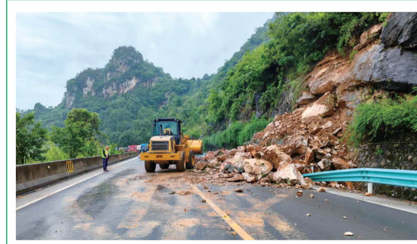
6月11日晚,因受持续降雨影响,关岭自治县公路管理段所管养的S105线K206+920处花江镇白泥村发生边坡塌方,导致交通阻断、道路损坏,存在极大安全隐患。关岭公路管理段组织人员迅速赶赴现场并启动应急预案,在塌方路段两端设置警示牌,安排专人指挥交通,并会同当地多个职能部门对塌方点进行抢修。图为施工人员对道路进行抢修。

陈彦霏曾多次获得校级、区级“三好学生”“优秀少先队员”“学习标兵”等荣誉称号,满怀着对未来的美好憧憬,陈彦霏继续在知识的海洋中遨游。