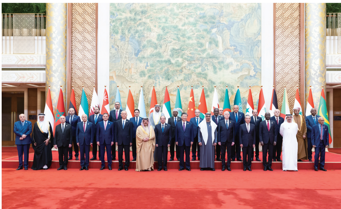
5月30日上午,国家主席习近平在北京钓鱼台国宾馆出席中阿合作论坛第十届部长级会议开幕式并发表主旨讲话。这是习近平同巴林国王哈马德、埃及总统塞西、突尼斯总统赛义德、阿联酋总统穆罕默德、阿盟秘书长盖特以及22位阿拉伯国家代表团团长合影。