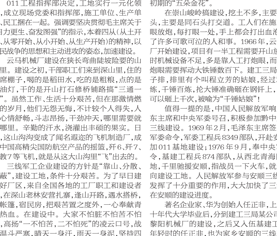
黎阳公司发动机总装现场

的品格高风。有时最朴实的信仰,恰恰能够成就超越时代局限的英雄壮举。于是就有了第一代三线建设者的长途迁徙、艰苦创业;于是就有了第二代第三代三线建设者的承受困难、光大精神,聚百亿元区、创造辉煌! 时空转换,岁月流逝。三线的无延与时俱进地拓展,三线的内涵依然如故地没有改变,而改变的只是一代代生命的容颜。当年的三线建设者有的已驾鹤西去,有的已风烛残年,当然还有更多的值得后来者敬重的先辈们依然健在并目睹着他们曾经抛洒热血、汗洒浇灌的贵州高原的这片热土。半世艰辛,半世征程;匆匆人生,匆匆脚步…… 夜空依然是群星闪烁,令人仰望与思索。人类精神认识真理的道路是多么回旋曲折,多么迷茫、艰苦和漫长!而三线的企业、山脉、河流乃至所有的人家,都会将历史告诉未来:它涌动的永远是热血汇成的长河,能染红一片土,映红一片天。所有的三线人都值得书写在历史中的篇章,后来人翻阅这些篇章,不仅会被感动、被打动,应该还会有冲动、有行动! 三线曾经辉煌,三线传承荣光;三线是家,三线更是情怀和梦想。