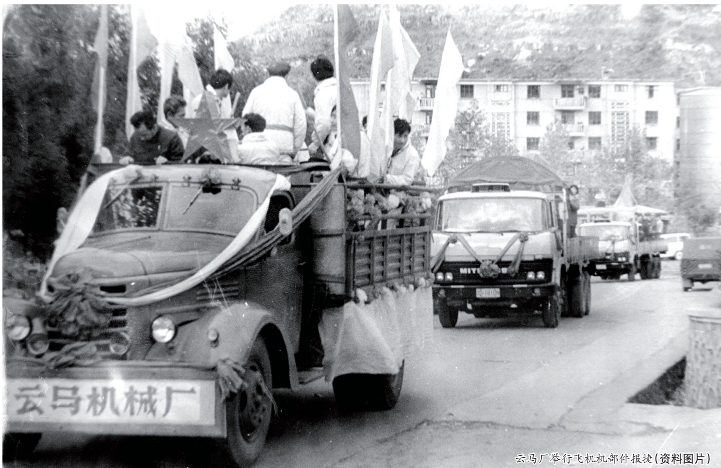
云马厂举行飞机机件报捷(资料图片)

1964年8月,三线建设各路大军响应号召,从祖国各地风尘仆仆汇聚黔中大地。建设者们打破古老大地的沉寂,在这里谱写了一部气壮山河、战天斗地的壮丽史诗。 这年9月,人民解放军铁道兵副司令员郭维城接到中央军委命令:筹建西南铁路建设指挥部。他立即从千里之外的大兴安岭铁路建设工地上,马不停蹄赶到了贵州安顺,选址在城区凤凰山脚下,快速建起了三线建设时期最重要的铁路建设大本营——西南铁路建设工地指挥部(简称“西工指”),铁道部长、铁道兵第一政委吕正操上将担任指挥长,铁道部副部长刘建章、铁道兵副司令员郭维城、国家科委副主任彭敏担任副指挥长。从此,“西工指”指挥着由铁道兵、铁道部技术人员、广大民工组成的30万建设大军,奋战川黔、滇黔、成昆三条铁路建设大会战,创造了许多世界铁路建筑史上的奇迹。 这年11月,煤炭工业部发出关于成立西南煤矿建设指挥部的通知,统一领导云南、贵州两省及四川一部分新矿区的生产建设工作。两个月后,西南煤矿建设指挥部(简称“西南煤指”)正式成立,煤炭部副部长钟子云、贵州省委副书记陈璞如分别担任会战指挥部党委书记、第二书记。指挥部设在安顺专区六枝县。“西南煤指”直接领导和管理六枝、盘县、水城3个矿区建设指挥部等12个单位。三线建设开始后,全国各地煤矿工业的专家学者、技术人员、熟练工人、党政干部和解放军官兵6万多人,浩浩荡荡开进乌蒙深山处,与当地各族群众一起投入三线煤矿大会战。 这年11月,国务院国防工业办公室发文,批准第三机械工业部成立贵州专区建设筹备处,决定在贵州山区建设一套歼击机科研生产大型基地(即011基地),这是实现中国航空工业由一、二线地区向三线地区进行重点战略转移的目标。