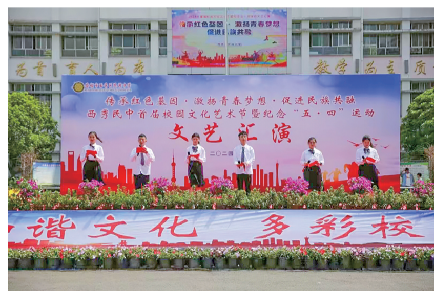
西秀区民族中学文艺汇演现场

本报讯(记者 李磊文/图)连日来,西秀区各中学陆续举行纪念五四运动文艺活动,丰富师生校园文化生活,弘扬“五四”爱国主义精神。