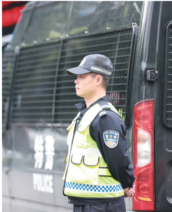
“五一”假期,普定县公安机关全面启动安保工作,守护节日平安。