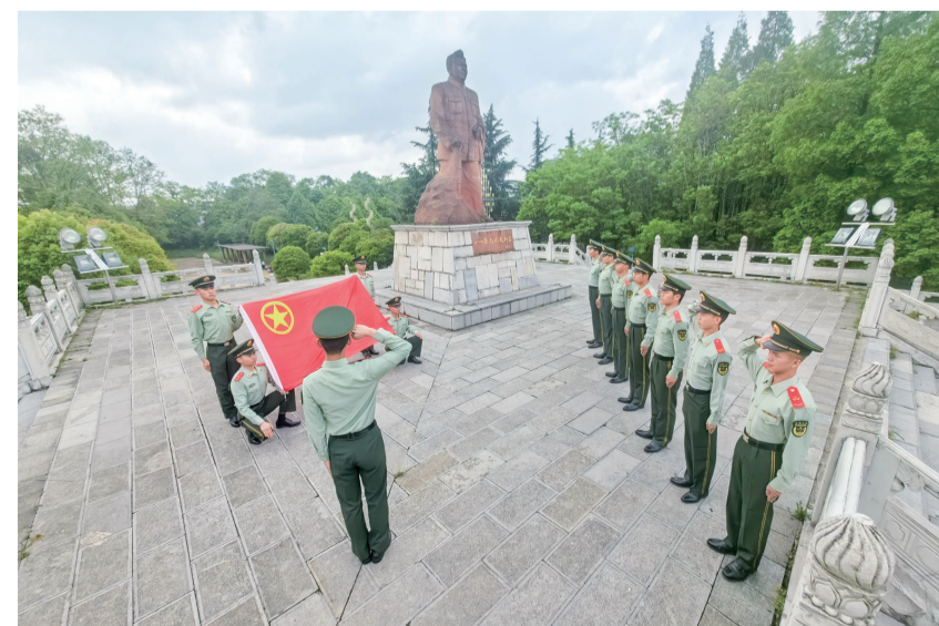
官兵们在庄严宣誓

本报讯(记者 罗野 唐国栋文/图)5月4日,武警安顺支队开展了“赓续红色基因 弘扬时代新风”主题团日活动,激励和动员全体青年官兵继承和发扬五四精神,引导青年官兵立志做“有理想、敢担当、能吃苦、肯奋斗”的新时代好青年。