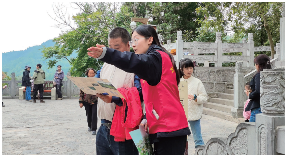
志愿者为游客提供便捷咨询