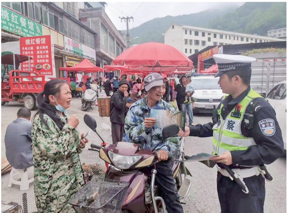
“五一”假期,紫云自治县各高速公路、景区景点迎来车流高峰。紫云公安交警坚守岗位,全力开展交通秩序维护疏导工作,保障节日期间交通运行平稳有序。