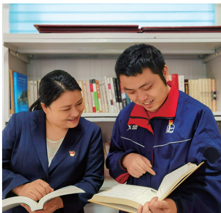
为推动智慧加油站建设,中石化贵州安顺石油部分加油站,打造职工阅读室、公益书屋,为职工与群众架起阅读平台。图为加油站员工在书屋阅读。