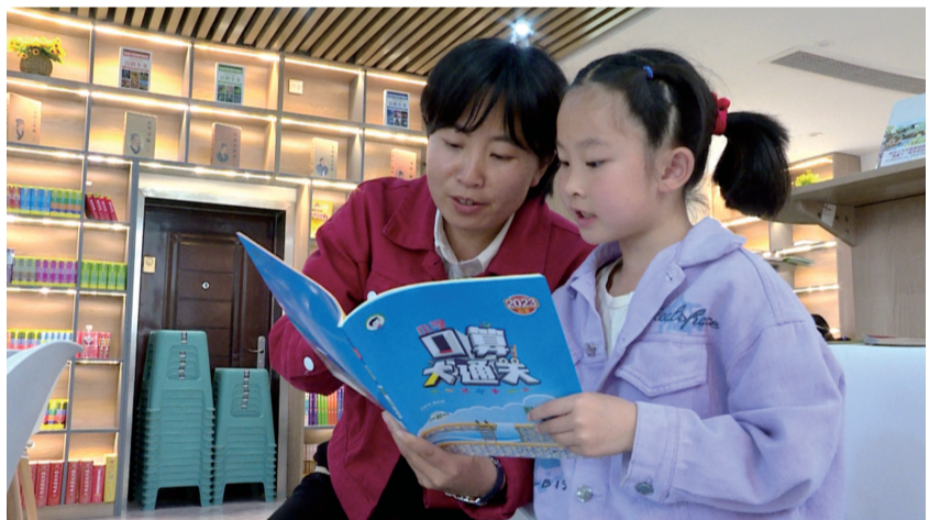
4月21日,普定县开展“4·23”世界读书日亲子阅读暨全民阅读推广活动。图为活动现场,家长陪同孩子阅读书籍。

会员、安顺道德讲堂总堂德师、鲁迅文学院作家班学员蒋平平现场分享了屯堡信仰中的家国情怀;中国散文学会会员、贵州省作家协会会员、贵州省民间文艺家协会会员、贵州省屯堡学会会员伍永鸿现场分享了屯堡文化与屯堡旅游。 分享会结束后,在座人员纷纷表示:通过老师们的分享,大家对屯堡文化有了更深入的了解,对此产生了浓厚的兴趣,在宣传屯堡文化工作上有了新的启发。