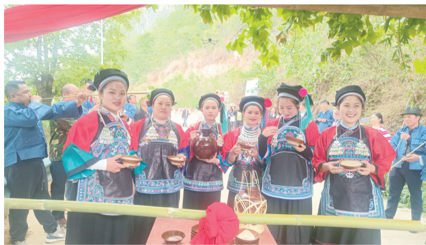
4月11日,紫云自治县火花镇九岭村举行布依族“三月三”民俗文化节活动。图为热情好客的村民为前来参加活动的客人满上拦寨酒。