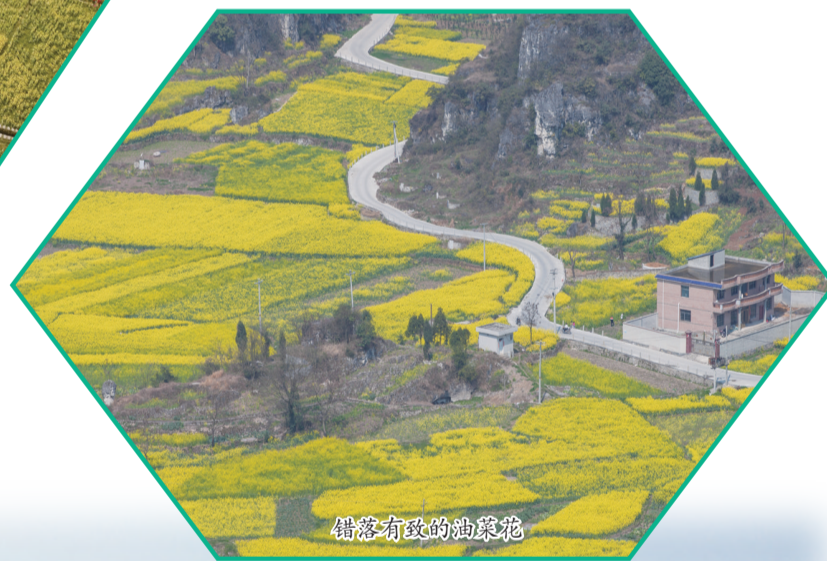
错落有致的油菜花