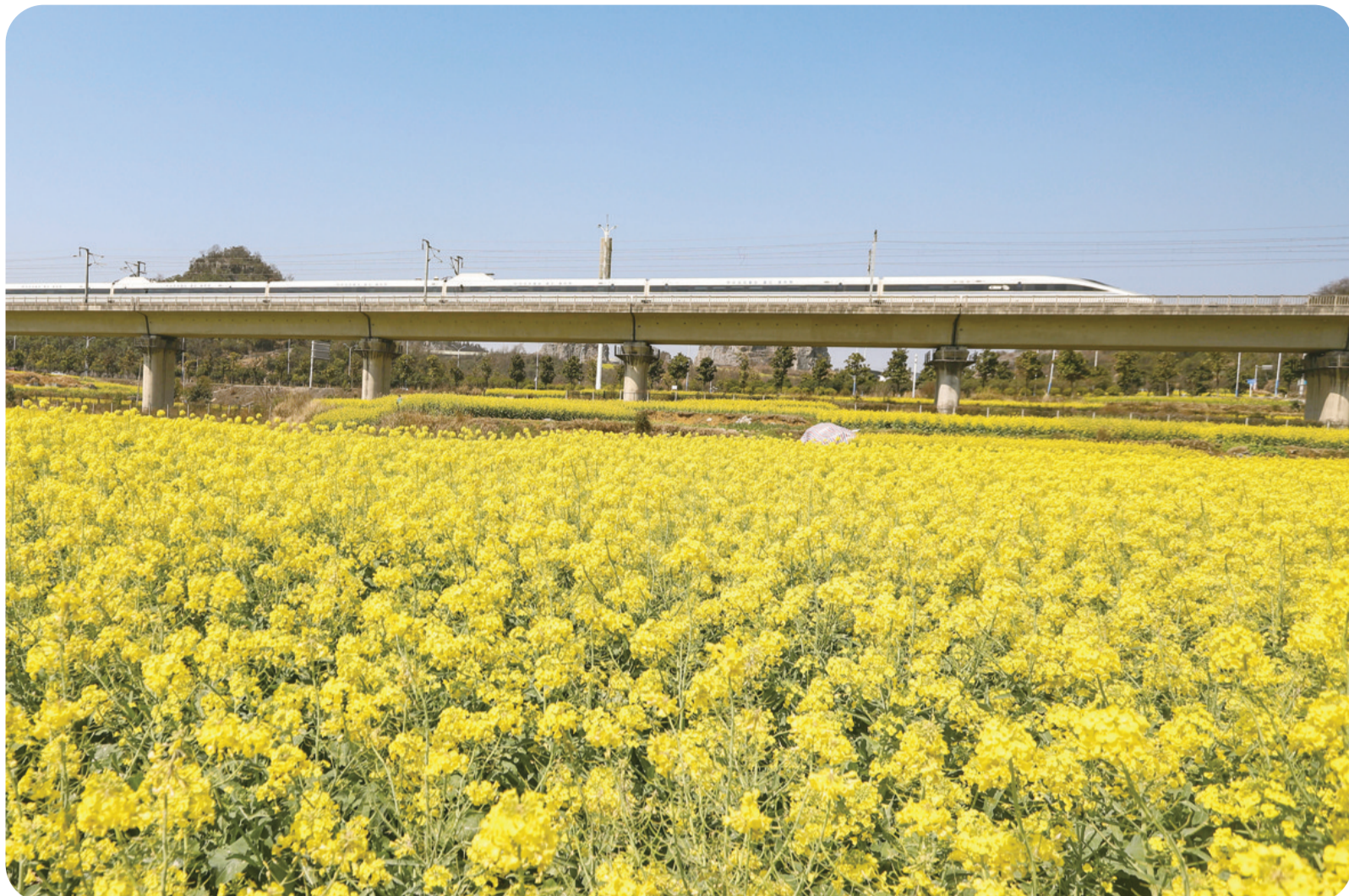
高铁列车驶过油菜花海