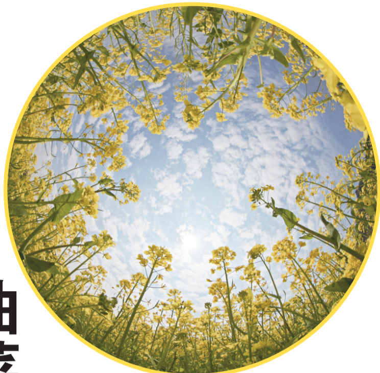
油菜花与蓝天白云