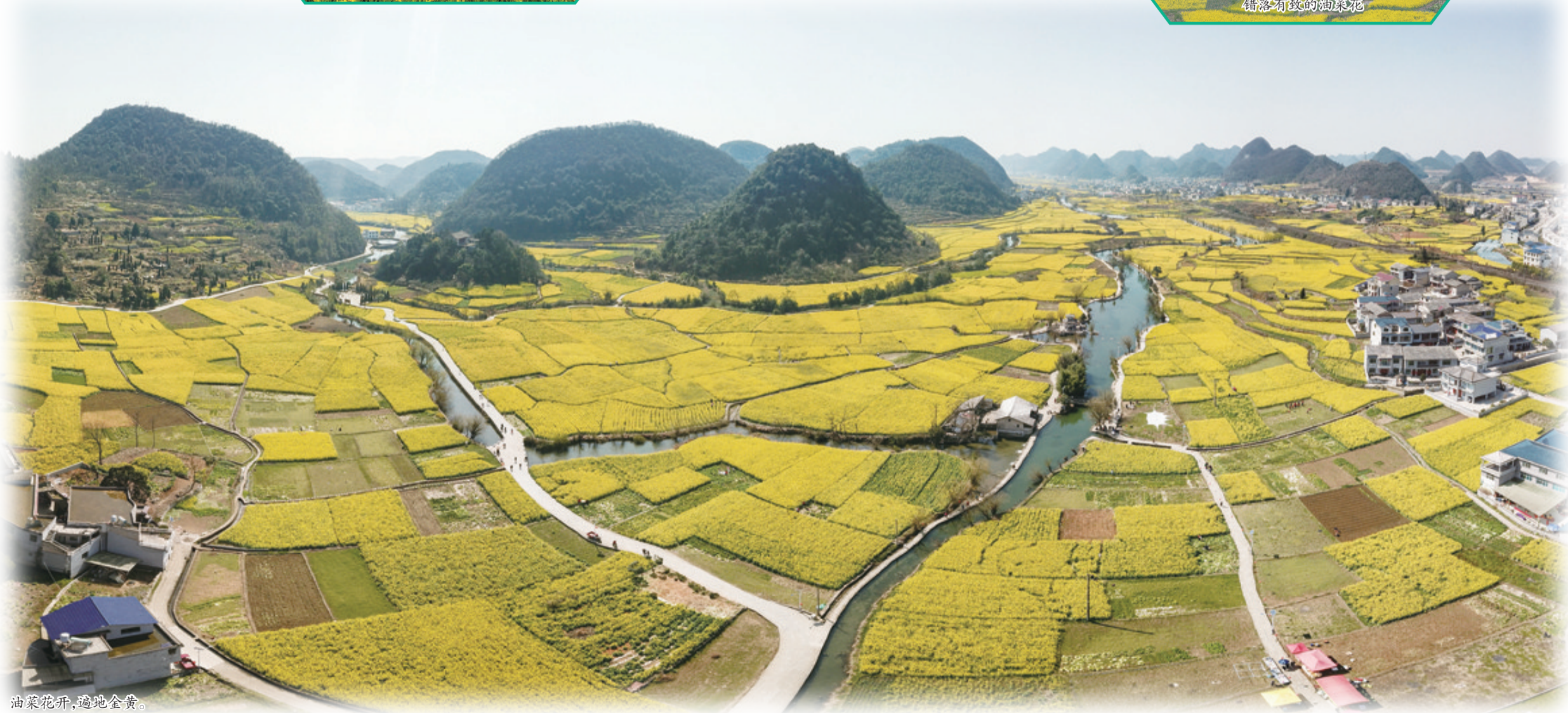
油菜花开,遍地金黄。