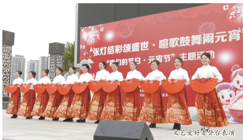
文艺爱好者登台表演