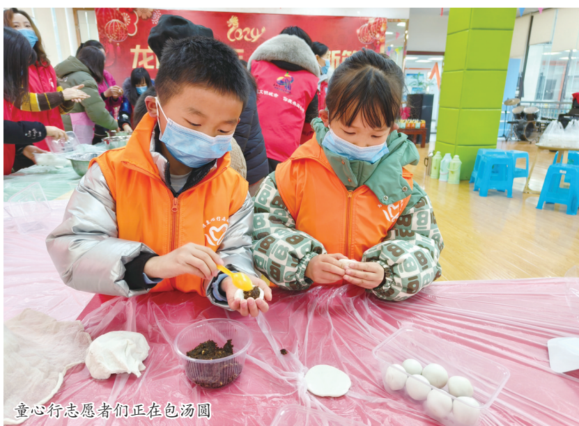
童心行志愿者们正在包汤圆

本报讯(记者 胡典文/图) 2月23日,西秀区马槽社区组织党员志愿者、大学生志愿者、童心行志愿者及居民群众共同开展“爱在一起 老少共庆元宵”系列活动。