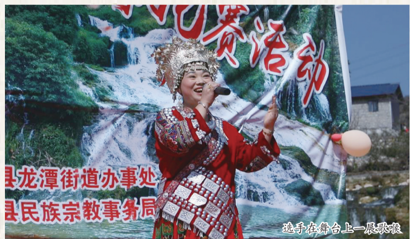
选手在舞台上一展歌喉

坪寨河畔,布依村寨;喜庆春节,山歌嘹亮。春节期间,位于关岭自治县龙潭街道的落叶新村成为当地近郊游的“必选地”,也成了当地百姓一展歌喉的大舞台。 走进落叶新村,沿坪寨河而行,潺