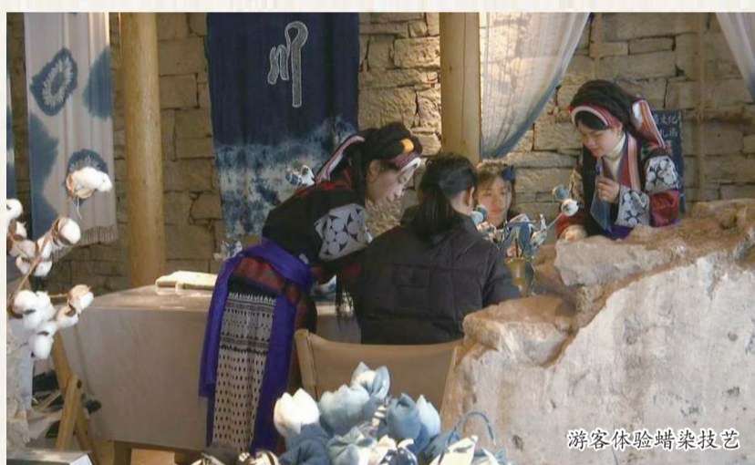
游客体验蜡染技艺