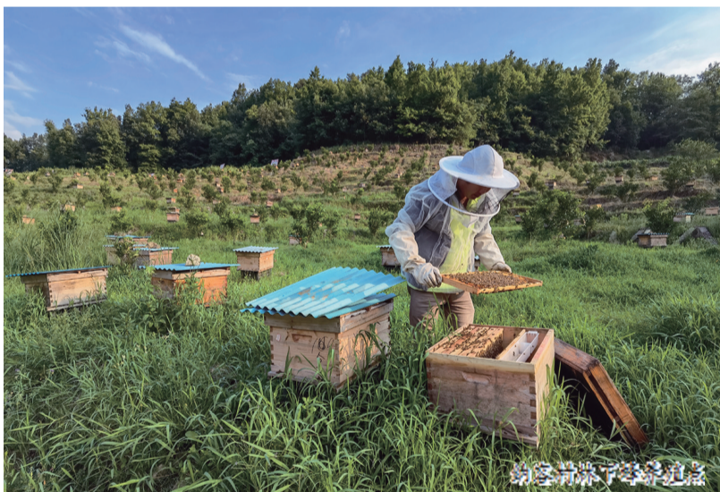
割菜熟练了蜂也甜