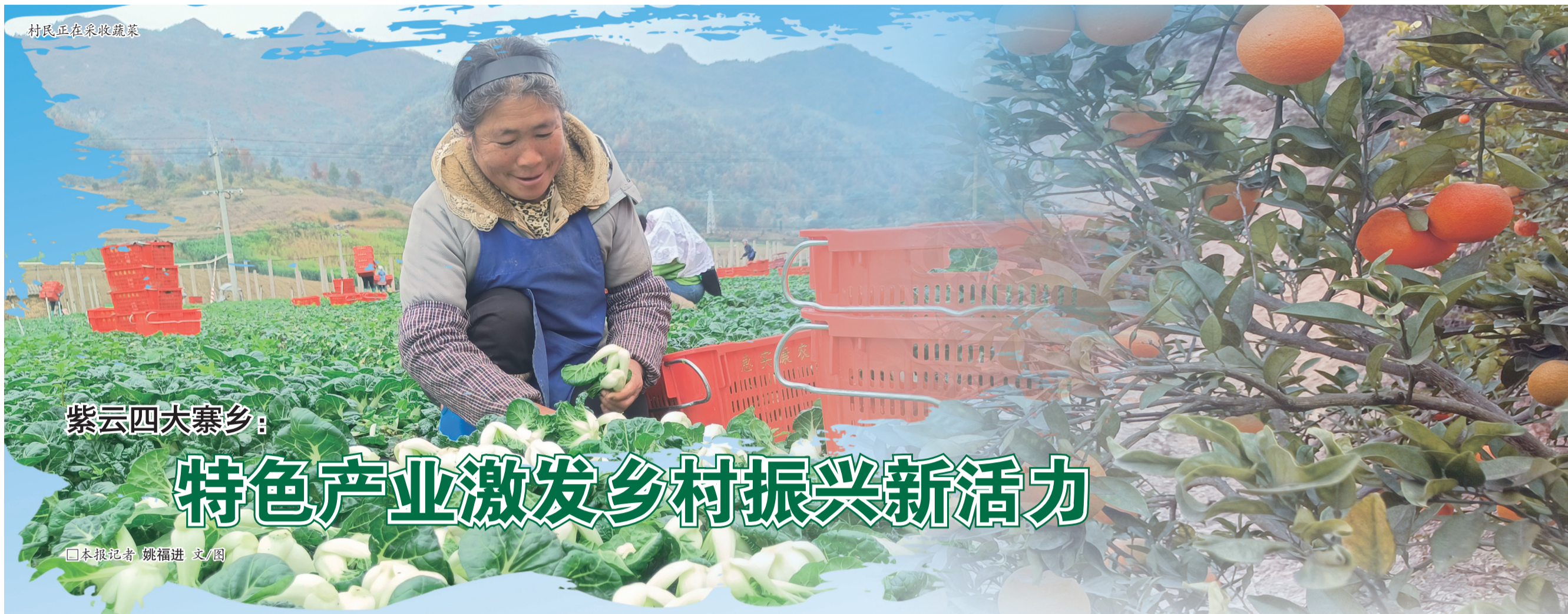
村民正在采收蔬菜