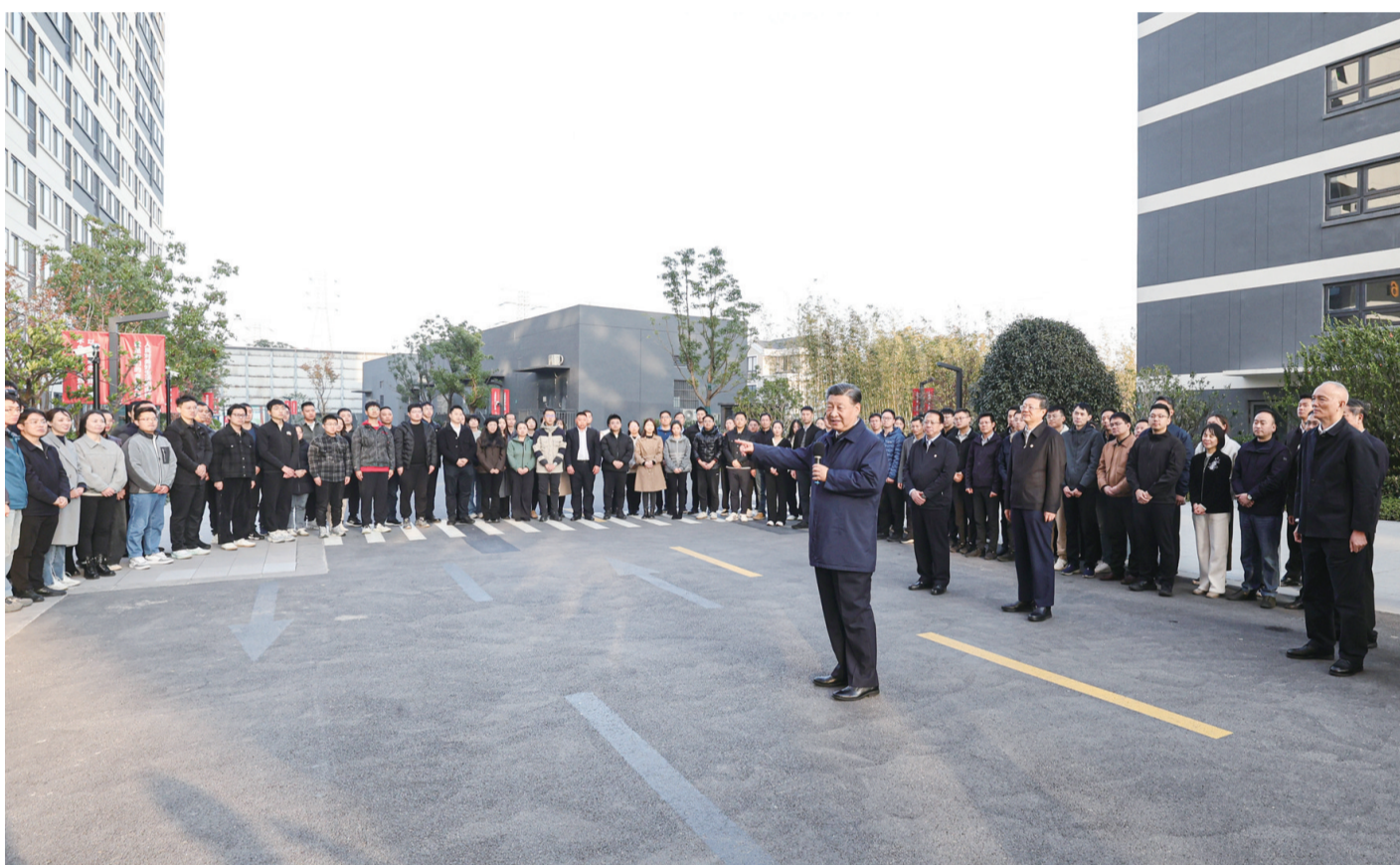
11月28日至12月2日,中共中央总书记、国家主席、中央军委主席习近平在上海考察。这是11月29日下午,习近平在闵行区新时代表城市管理者之家,同社区居民亲切交流。

新华社上海/江苏盐城12月3日电 中共中央总书记、国家主席、中央军委主席习近平近日在上海考察时强调,上海要完整、准确、全面贯彻新发展理念,围绕推动高质量发展、构建新发展格局,聚焦建设国际经济中心、金融中心、贸易中心、航运中心、科技创新中心的重要使命,以科技创新为引领,以改革开放为动力,以国家重大战略为牵引,以城市治理现代化为保障,勇于开拓、积极作为,加快建成具有世界影响力的社会主义现代化国际大都市,在推进中国式现代化中充分发挥龙头带动和示范引领作用。