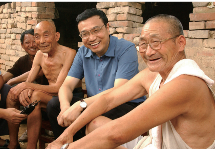
二〇一三年八月八日,李克强同志在河南省新乡市调研。这是李克强同志在原阳县桥北乡马庄村与村民亲切交谈。

李克强同志认真贯彻党中央决策部署,坚持从中国国情出发,坚持和完善社会主义基本经济制度,持续推动经济体制改革,坚持社会主义市场经济改革方向,处理好政府和市场的关系,使市场在资源配置中起决定性作用,更好发挥政府作用,推动有效市场和有为政府更好结合。(下转3版)