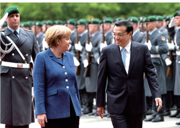
二〇一三年五月二十六日,李克强同志在柏林出席德国总理默克尔举行的欢迎仪式。