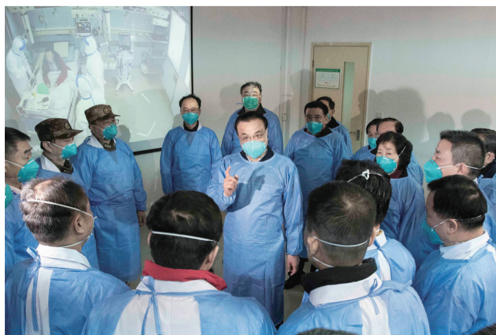
二〇二〇年一月二十七日,李克强同志赴湖北省武汉市考察指导疫情防控工作,代表党中央、国务院慰问疫情防控一线的医务人员。