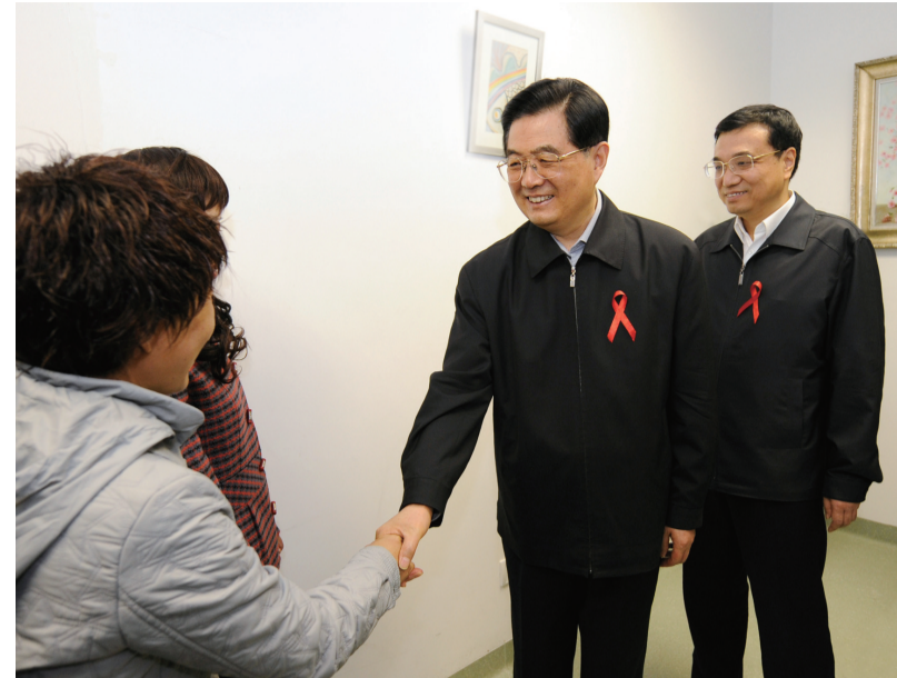
2008年12月1日是第21个世界艾滋病日。胡锦涛同志和李克强同志来到北京地坛医院考察艾滋病防治工作。