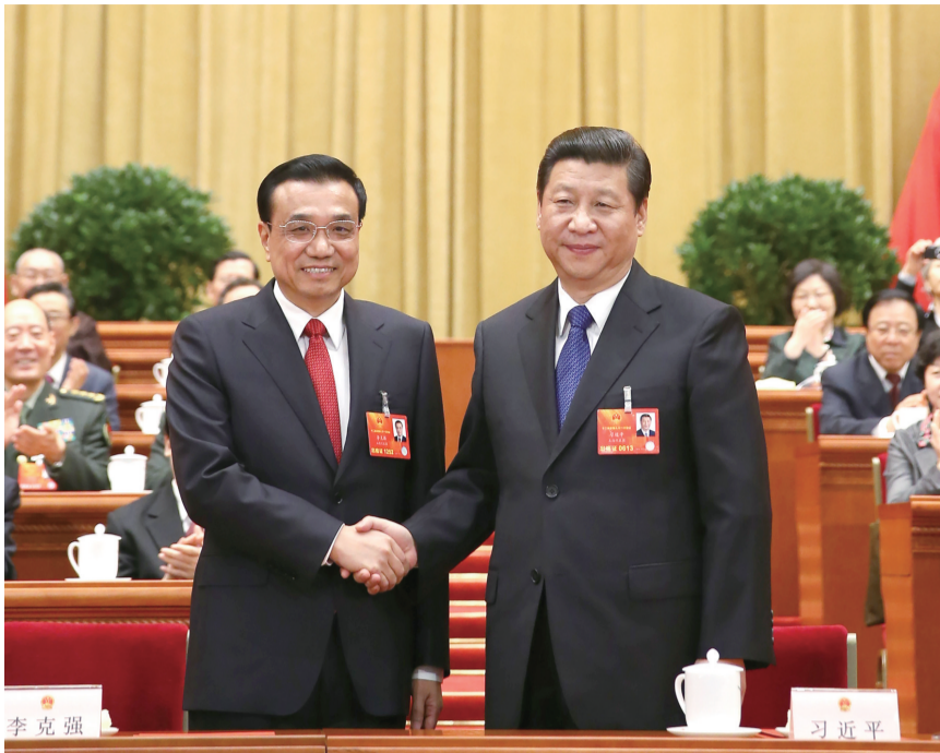
2013年3月15日,第十二届全国人民代表大会第一次会议在北京人民大会堂举行第五次全体会议。会议经过投票表决,决定李克强为中华人民共和国国务院总理。这是习近平同志和李克强同志亲切握手。