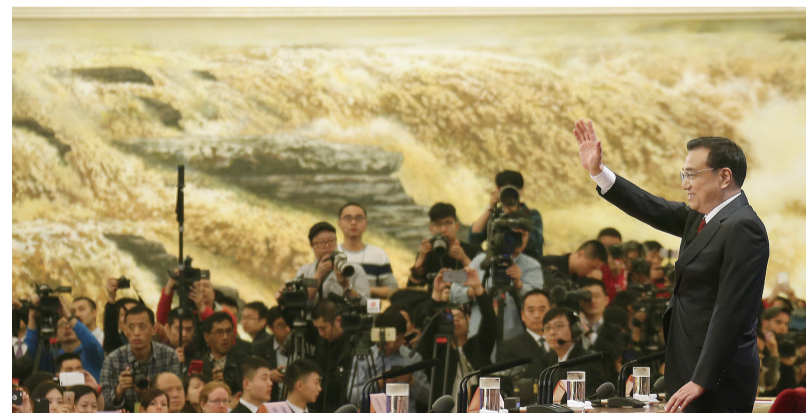
二〇一六年三月十六日,李克强同志在北京人民大会堂与中外记者见面,并回答记者提问。