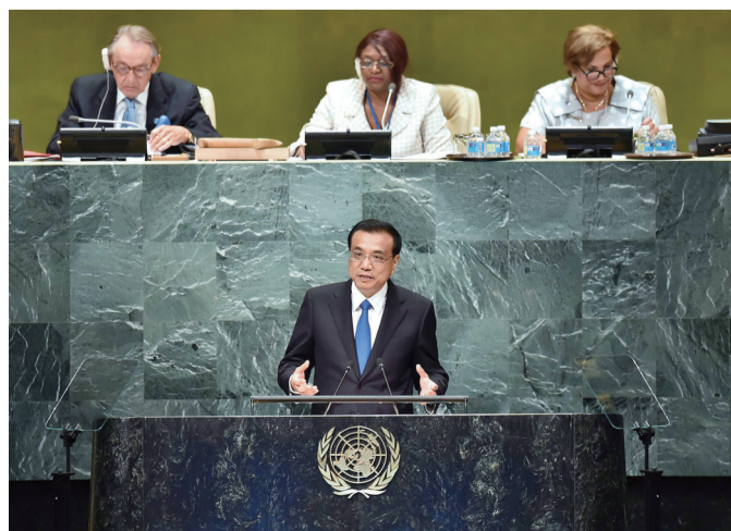
二〇一六年九月二十一日,李克强同志在纽约联合国总部出席第七十一届联合国大会以“可持续发展目标:共同努力改造我们的世界”为主题的辩论并发表题为《携手建设和平稳定可持续发展的世界》的讲话。