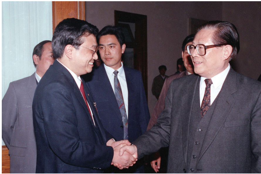
1993年5月3日下午,中国共产主义青年团第十三次全国代表大会在北京人民大会堂开幕。在5月3日上午的预备会议后,举行第一次主席团会议,推选李克强等同志为主席团常务主席。这是江泽民同志与李克强同志握手。