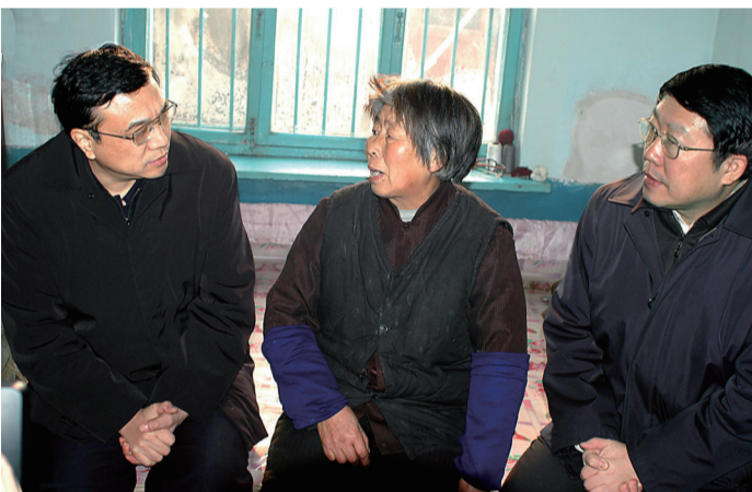
二〇一四年十二月二十六日,李克强同志到辽宁省抚顺市莫地沟棚户区居民王淑贞家中走访调研。