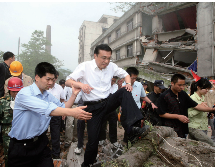
二〇一八年五月十九日,李克强同志在四川地震灾区察看灾情。