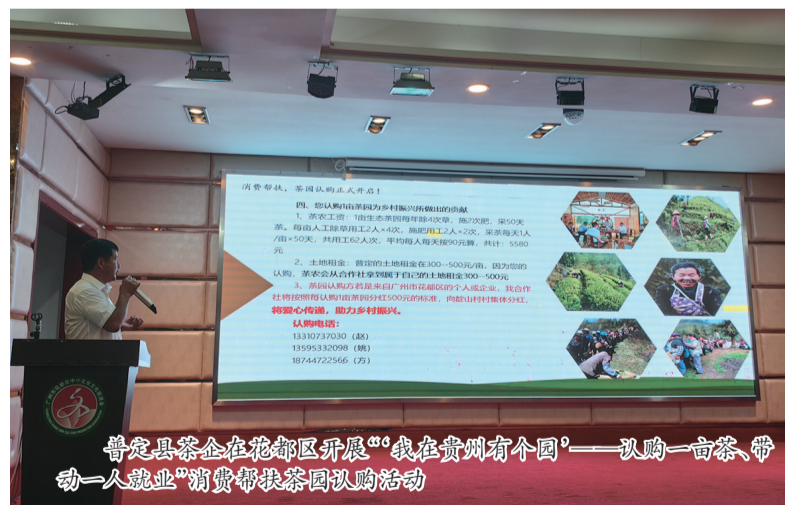
普定县茶企在花都区开展“我在贵州有个园”认购一亩茶、带动力一就业”消费帮扶茶园认购活动