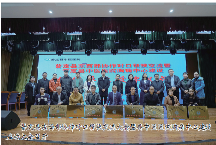
普定县东西部协作对口帮扶交流暨普定县中医医院胸痛中心建设启动仪式

金1400多万元,重点帮助普定县打造2个省级示范村、2个市级示范村,且将花都区打造美丽生态、美丽经济、美丽生活“三美”融合的幸福乡村“花都样本”经验在普定进行复制推广,着眼生态、经济、生活,坚持示范带动、产业优先、提升服务,推动普定县打造了焦家村、靛山村、水井村、后寨村等一批具有带动示范效应的东西部协作宜居宜业和美乡村。