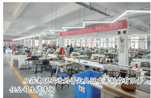
从花都区引进的普定县朵贝皮具制品有限公司生产车间