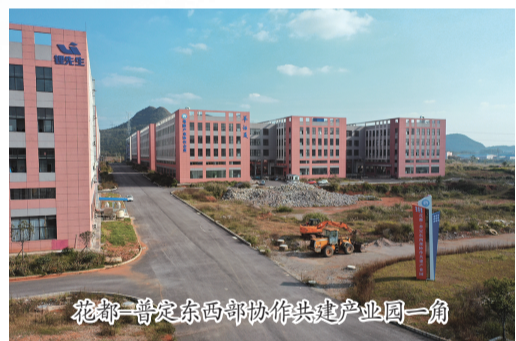
花都·普定东西部协作共建产业园一角