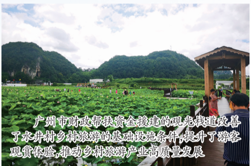
广州市政府帮扶资金建设的观光茶园改善了穿洞乡穿洞村的旅游基础设施条件,提升了游客观赏体验,推动乡村旅游产业高质量发展

在普定工业园区,今年6月,两地顺利揭牌“花都区-普定县东西部协作共建产业园”,采取“花都总部+普定基地”“花都研发+普定制造”等合作模式,陆续新增落地锂电池、皮具、乐器、包装材料制造等多个企业项目,逐步打造成“短链轻工”产业集聚区,增加了县域就业容量,增强了协作地区发展活力。并安排东西部协作资金,在园区新建集特色培训、就业推荐、公共就业服务、劳务品牌创建、创业孵化等功能为一体的“花都·普定东西部协作共建产业园配套就业实训基地”,更好地服务于园区企业,为企业培训技术工人。