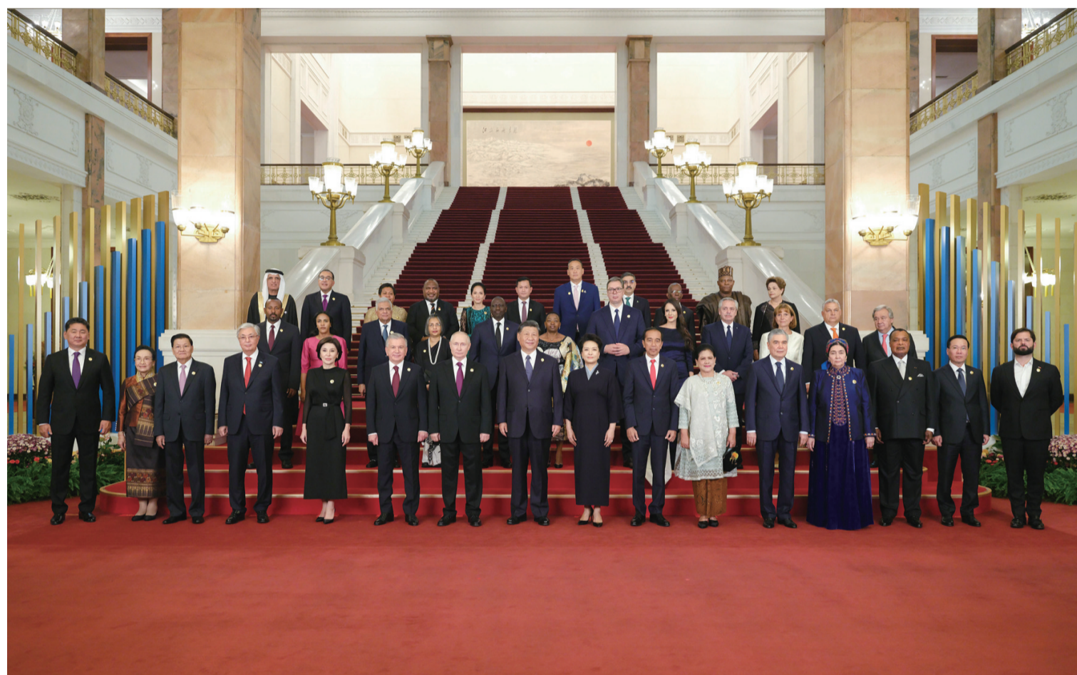
10月17日晚,国家主席习近平和夫人彭丽媛在北京人民大会堂举行宴会,欢迎来华出席第三届“一带一路”国际合作高峰论坛的国际贵宾。这是习近平和彭丽媛同国际贵宾合影留念。