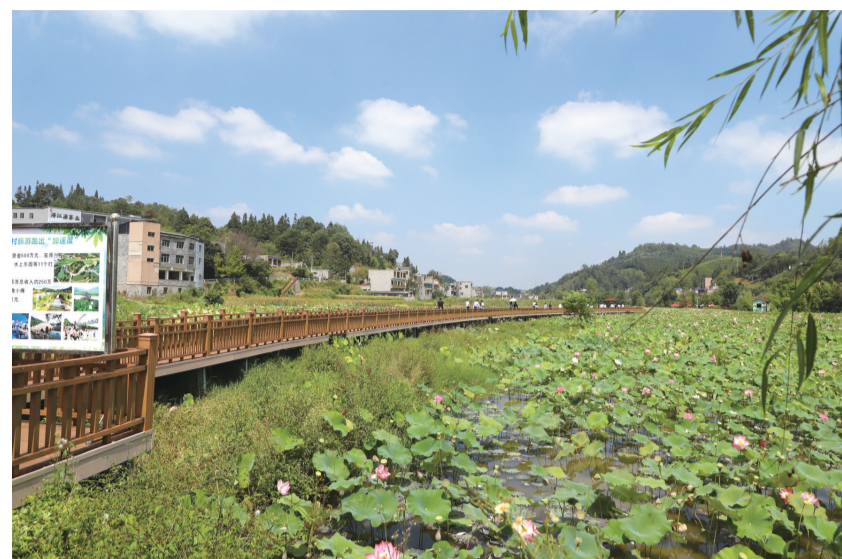
九溪村秀丽景色美如画

秋日的西秀区大西桥镇九溪村,清澈的邢江河穿村而过,映照着湛蓝的天空,草木青翠。上百亩荷塘里片片荷叶随风摇曳,一幅山水田园画尽显眼前,吸引了不少游客前来打卡游玩。