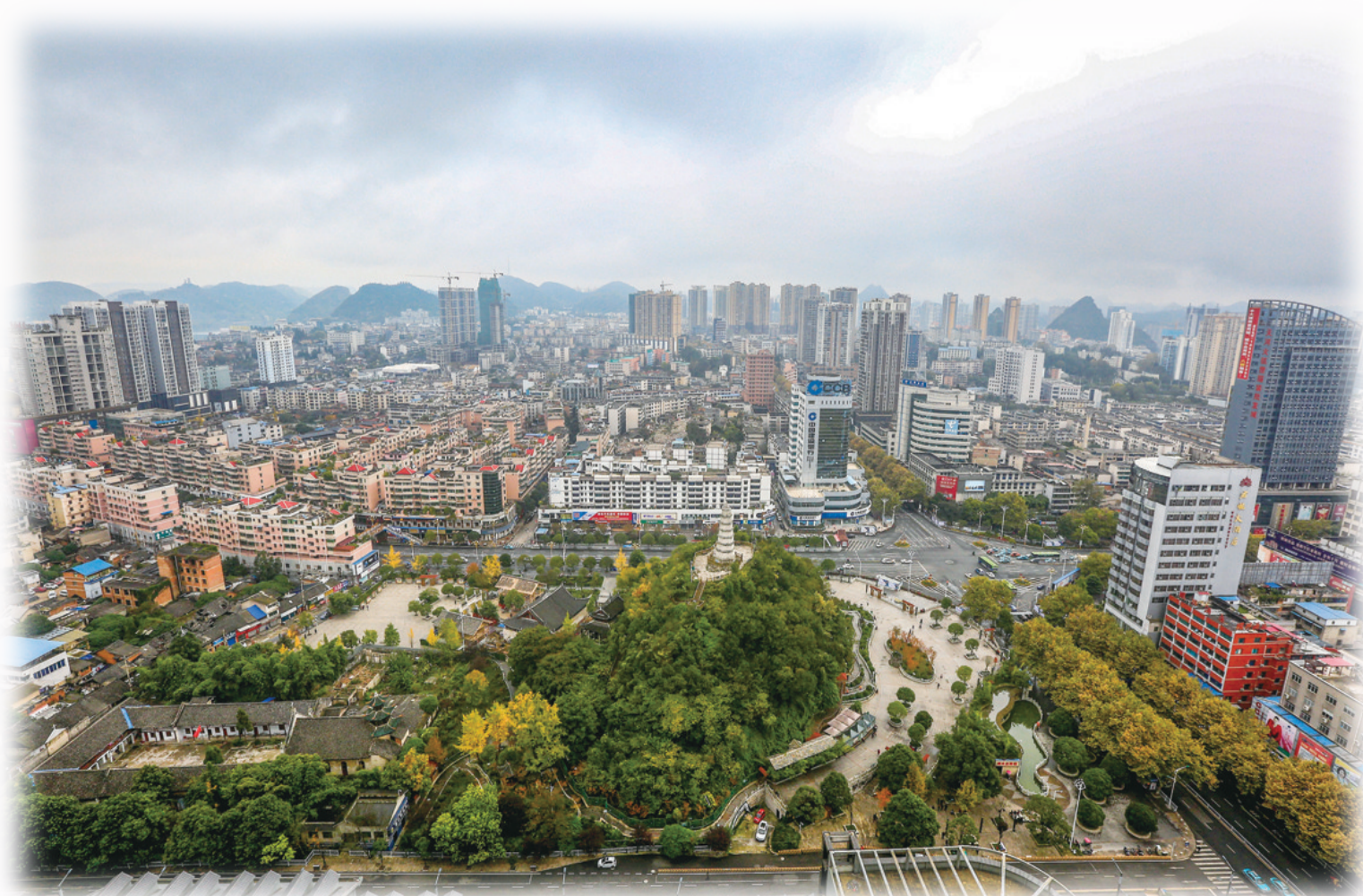
西秀区塔山片区

今年以来,聚焦宣传发动,积极营造氛围。形成了镇村互动、群众参与的宜居乡村创建良好工作格局,营造乡村建设大家干,创建成果大家享的共建共治共享氛围。聚焦示范带动,干群合力共建,共组织2500余人次参与,开展环境卫生整治行动120余次,拆除违建建筑10处,私搭乱建4处,老旱厕1处,共清运垃圾30余吨,清理河道总长约4公里。