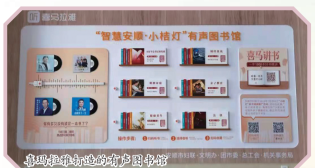
喜马拉雅打造的有声图书馆