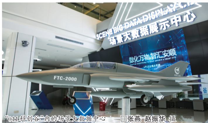
“011科创谷”内的场景大数据展示中心 □张燕 赵振华 摄