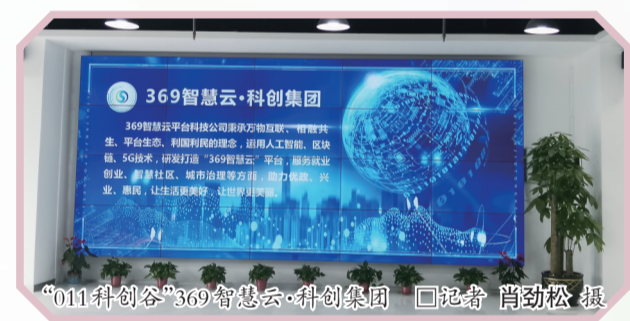
“011科创谷”369智慧云·科创集团