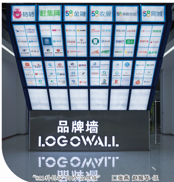
“011科创谷”内的“品牌墙”

“社区是智慧城市建设重要的组成部分,涉及到人们的衣食住行、休闲娱乐等方面,我们认为这一领域大有可为。”李春表示,公司围绕智慧社区等方面的有关业务已经在加快部署,利用数字化手段加速构建社群经济消费新体系,未来计划打造千亿级的产业集群。