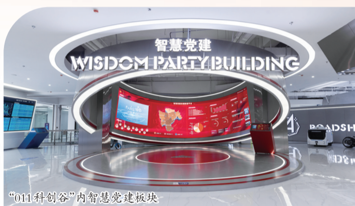
“011科创谷”内智慧党建板块

据悉,喜马拉雅已经与安顺相关部门达成初步合作意向,希望为安顺培养出更多优秀的声音人才。最终目标是打造一个声音产业园,为用户提供更优质的声音产品,用声音传播知识和文化,用声音收集数据、赋能产业、服务生活,促进安顺经济社会发展。