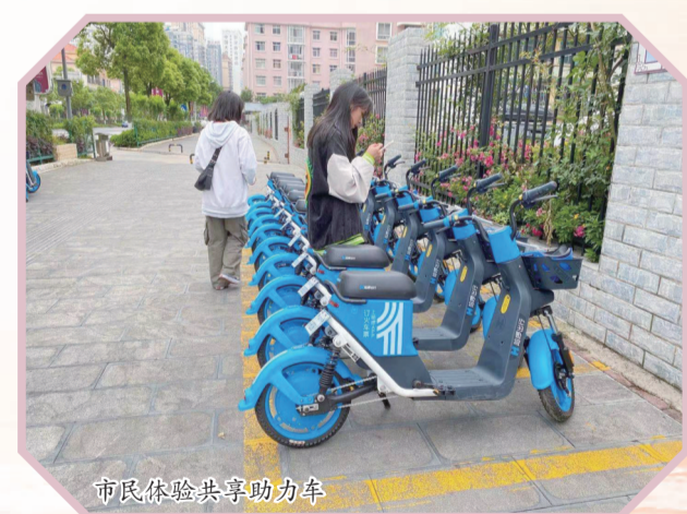
市民体验共享助力车