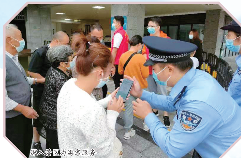
深入景区为游客服务

自党史学习教育开展以来,黄果树旅游区深入开展“我为群众办实事”实践活动,聚焦“五个着力”,扎实抓好各项群众急难愁盼实事,为推动高质量发展,实现“十四五”良好开局提供坚强保障,切实做到学党史、悟思想、办实事、开新局。