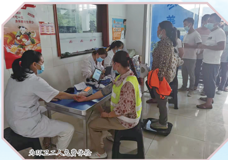
为环卫工人免费体检