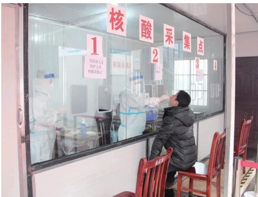
市民正在进行核酸采集

发热门诊高风险人群核酸检测实行中午不间断,周末不休息。 与此同时,为方便市民群众检测核酸,做好疫情防控工作,西秀区人民医院10月27日起为市民群众提供24小时核酸采样服务,普通市民可到该院主入口大平台核酸采集点进行检测。该院发热门诊核酸采集同样实行24小时工作制,但只针对发热门诊就诊患者。市民可按照医院公布的“安顺市西秀区人民医院智慧医院二维码”进行提前预约即可快速便捷进行核酸检测。 此外,记者还了解到,随着我市各级医疗机构核酸检测量较往日大幅增加,为保质保量完成检测任务,我市卫健部门加强统筹协调,一方面持续提升检测效率,一方面加强人力投入,增加检验批次,PCR核酸实验室的人员24小时轮流值守实验室,加班加点只为争分夺秒把每天采样的结果,准确、及时地送到检测者的手中,群众最快4小时可收到检测结果报告。