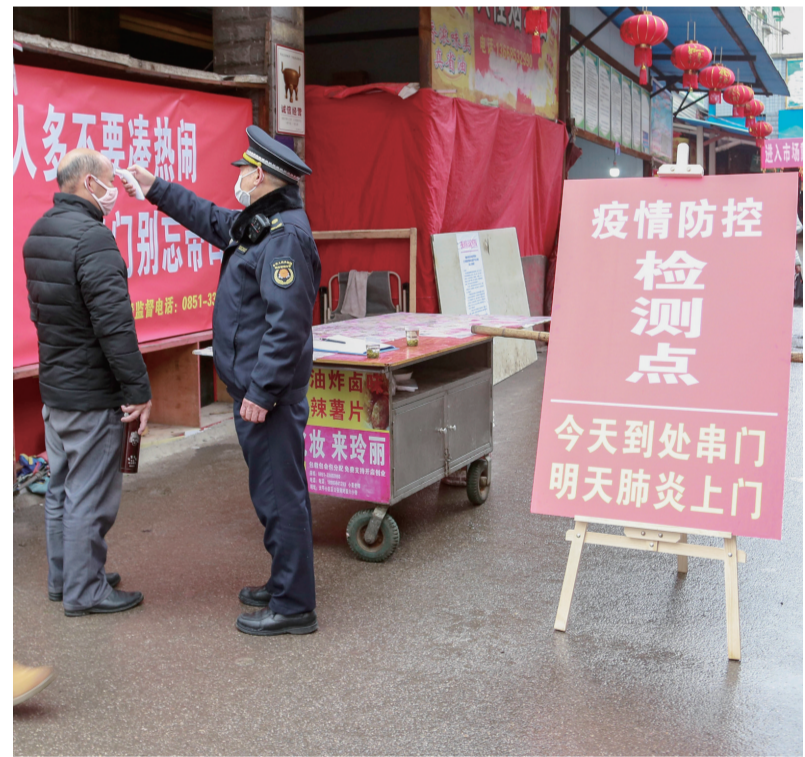
10月28日,记者在校场路北街农贸市场看到,工作人员对进入市场的市民进行体温测量并查看“两码”,确保防控工作精准有效,切实保障人民群众生命安全。

速组成消杀突击队、环境整治突击队和技术指导组赶赴现场开展消杀及环境整治处置工作。 演练中,参演各部门按照“统一指挥、精简高效、快速反应、部门联动、各司其职”的原则,闻令即动、密切配合、快速反应,根据指令内容自觉行动,联防联控,及时阻断病毒传播途径,防止疫情扩散蔓延,演练达到了预期目的。 此次演练组织严密、指挥有序、措施有力、贴近实战,是对紫云自治县秋冬季疫情防控消杀及环境整治应急处置能力的一次综合检验,充分展示了各部门在疫情防控工作中的团结拼搏、敢打硬仗的精神,为疫情防控工作打下坚实基础。