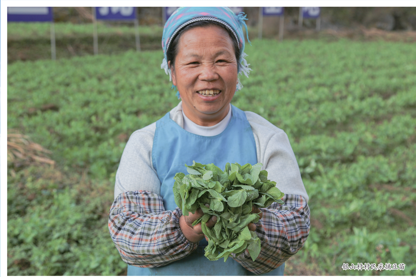
银山村村民采摘豆角

“格凸河镇有银山、格井、二关、长田、大河苗寨等多个传统民族村寨,那里的苗族村民历来爱歌爱舞;且格凸河镇自然生态资源丰富,是开展户外运动和攀岩体验等活动的好地方。”韦朝府说,随着基础设施建设的逐步完善,把文旅、农旅、体旅融合起来,让更多的人来格凸河观光旅游、采摘体验、休闲度假等,推进农家餐馆、农家旅馆、旅游商品等旅游经济的发展,拓宽贫困群众脱贫致富路子。