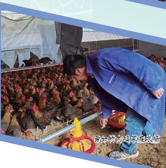
旁如村肉牛养殖场