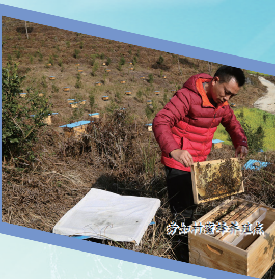
旁如村苗寨茶基地