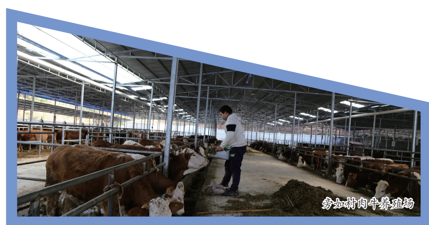
旁如村肉牛养殖场