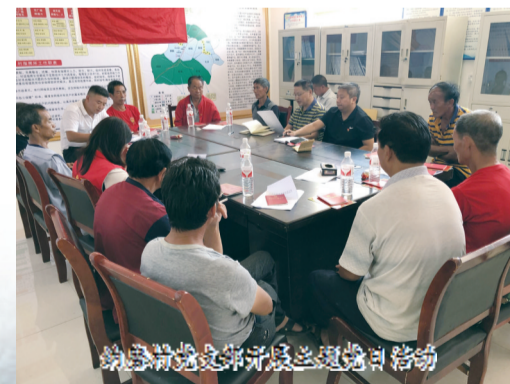
纳下小学搬迁开学暨金秋助学启动仪式

献出爱心和真情的同时,也收获了老百姓的感恩和信任。一枝一叶总关情,自市教育局驻村帮扶工作组进驻以来,扎根农村、俯身为民,一件件、一桩桩真情帮扶的事迹如涓涓细流滋润着当地群众的心田。