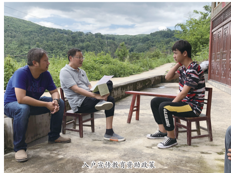
入户宣传教育资助政策