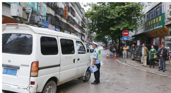
交警向过往车辆进行宣传

意,决定对安平街北段(塔山西路与安平街交叉至原太平小区环岛路口)施行单向交通组织。同时,从6月12日也就是昨日起,安平路单行允许所有车辆由塔山西