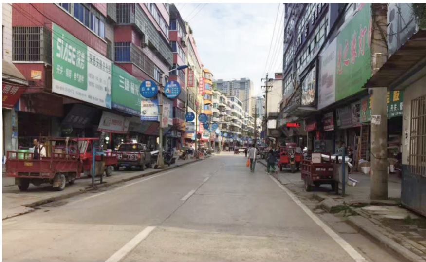
昔日拥堵的安平街如今变得畅通无阻