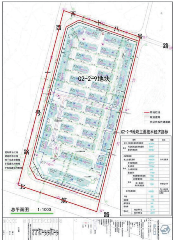
调整前总平面布置图