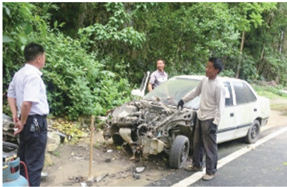
龙宫景区整治拆除“僵尸车”现场

本报讯(文/图 记者 唐琪)城市角落中长期无人使用维护的废弃车辆,日渐破败损毁,不仅影响了城市形象,高温天气下还可能发生汽车自燃现象,存在着安全隐患,有人称其为“僵尸车”。