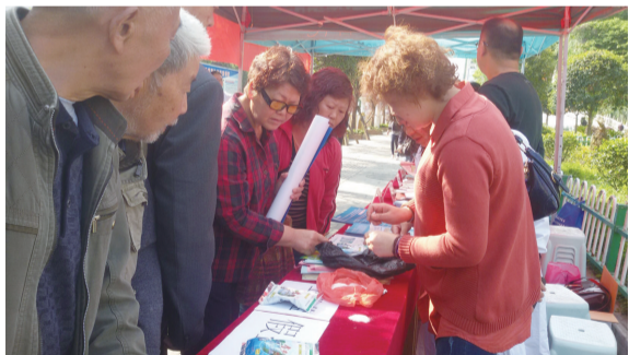
工作人员教市民如何辨别假盐和工业盐

本报讯(文/图 记者 周大义)5月15日是我国第23个“防治碘缺乏病日”,今年的宣传主题为“坚持科学补碘,建设健康中国”。5月17日,为倡导本市居民科学补碘,市卫计委、市疾控中心、西秀区卫计局、区疾控中心等多部门以2016年全国防治碘缺乏病日为契机,围绕今年的宣传主题,在塔山广场开展了防治碘缺乏病宣传活动。