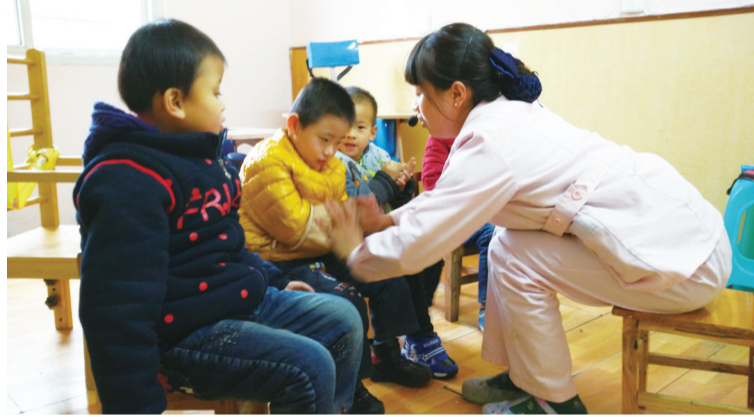
儿童康复中心康复治疗师训练患儿动手能力