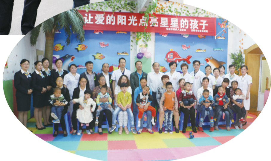
副市长熊元到我院指导开展“关注孤独儿童”活动

院区环境条件简陋,难以为患者提供舒适的就医环境,限制了医院自身的发展,也难以让更多的患者提供优质的服务。这个问题成了安顺市委、市政府一块心病,也是全市千禧医院最大的心病,为圆满解决这个难题,市妇幼保健院今年6月将整体搬迁至新院区。新院区设立市妇幼保健院和专科医院,突出“以病人为中心”的设计理念,着眼于未来妇女儿童健康服务的需要,按照三级甲等专科医院的标准进行设计施工。搬迁新院区,科学化、人性化的就医环境和医疗服务,将大大提升病人就诊的舒适度和满意度,更好地为更多的妇女儿童提供更优质的健康服务,并结束该院儿童康复中心、儿童保健中心、眼科等科室多年来因业务用房不足而分散运行的局面。