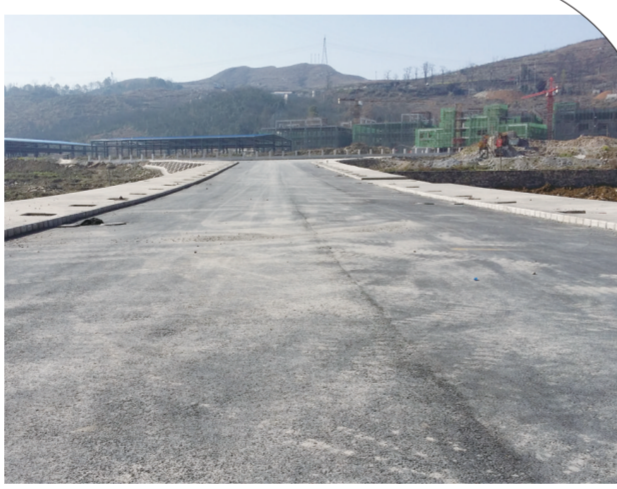
在建的大健康民族食药园