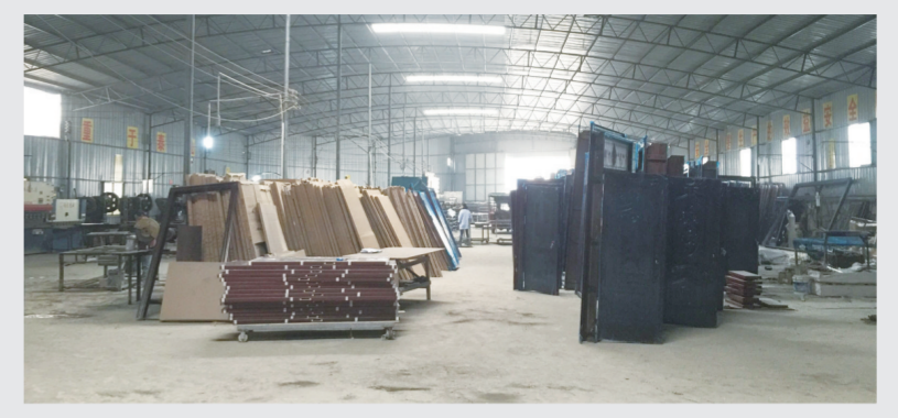
在关岭产业园区扶持下,鑫佳旺门业有限公司已发展成为规上企业。图为生产车间一角。

产业园区作为工业发展的重要载体,是推动地方经济发展的主导力量,是扩大对外开放的重要平台。园区兴,则经济兴;园区强,则经济强。在面对经济下行压力加大的大背景下,关岭产业园区主动谋划、强化服务、狠抓落实,“一区多园”格局日趋完善,一批引领性的大项目、好项目悄然崛起,一个个返乡创业新星涌现出来。请看本报走进工业园区特别报道。