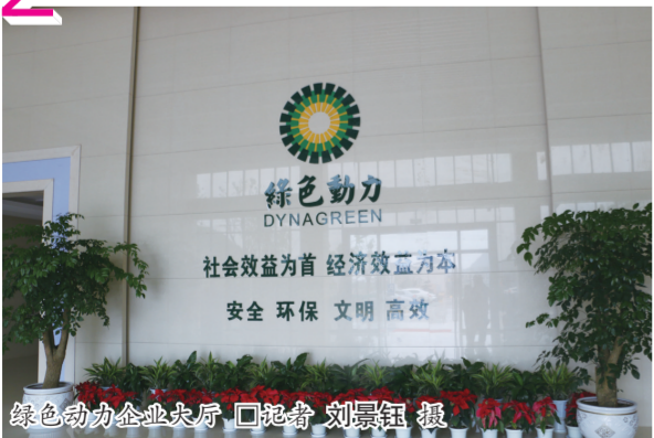
绿色动力企业展厅

安顺绿色动力再生能源有限公司垃圾发电新能源项目,项目规划设计日处理生活垃圾能力为1050吨,总投资约4.9亿元人民币。