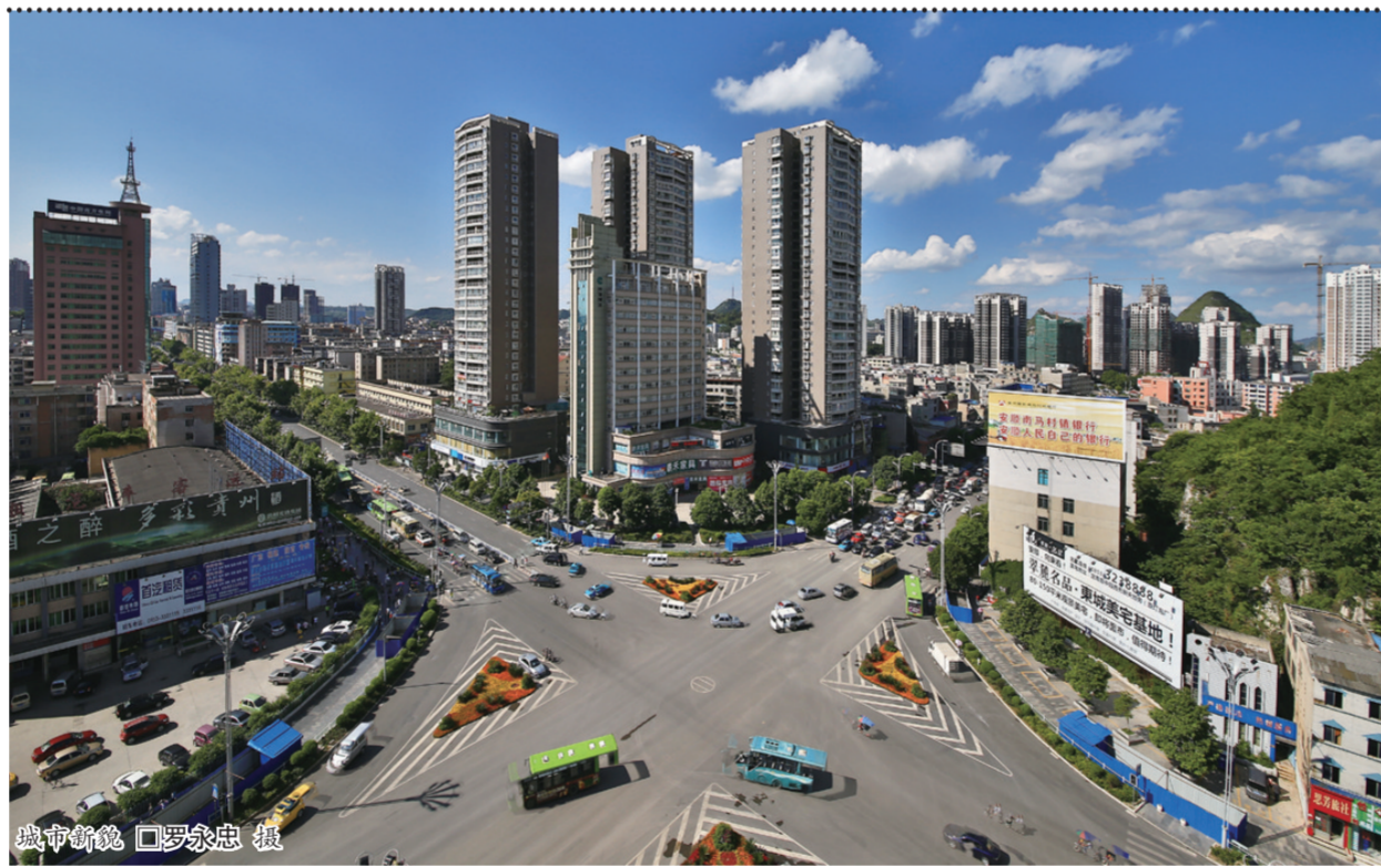
城市新貌

在项目建设过程中,区政府给予了大力扶持,补给企业每吨70元垃圾处理费,有力推动了项目的建设。