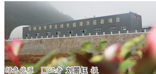
绿色能源

安顺市餐厨垃圾综合利用和无害化处理工程,总投资12500万元,10月初一期投入使用,日处理餐厨垃圾量将达50吨。