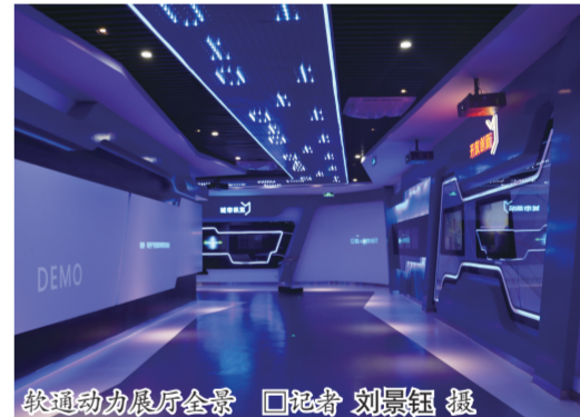
软通动力展厅全景

西秀区作为国家信息消费试点城市,当前已出台《西秀区国家信息消费试点城市规划》,着力加快“三网”融合,探索将物联网、云计算等新技术应用到城市规划、基础设施建设、公共服务等领域,加快和智慧城市、智能楼宇、智能家居、路网监控、智能学校、智能医院等的试点建设,创新“互联网+”与社会公共服务体系融合发展,使城乡居民足不出户享受到生活消费、家政服务、远程缴费、社保医疗等社会服务,让市民生活更加便利。