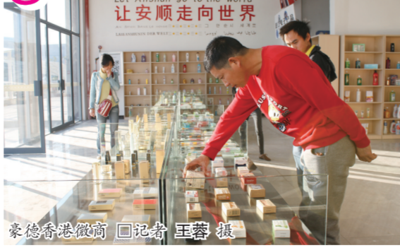
豪德香港微商

该项目是由香港豪德集团投资建设的城市大商贸及大物流的产业综合体,项目总投资26亿元,总规划用地约1200亩,是一个涵盖五金机电交易、建材装饰交易、百货农副交易、物流货运交易、电子商务交易等五大功能组合区,能够满足“一站式采购”需要的功能,项目全面建成后将辐射西南地区的大型综合性商贸物流中心。目前已完成投资6.8亿元,建成商铺12万平方米、物流中心15万亩、仓储中心8000平方米、综合办公大楼1.28万平方米,入驻商家260余家(含电商)。通过电子商务带动传统企业转型升级,“黔货出山”、“安货出山”正在成为现实,该项目的全面建成将成为西秀区发展电子商务产业的重要引擎和强力驱动,是该区打响了电子商务发展的第一枪。