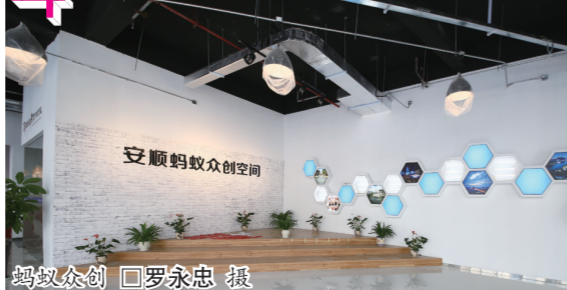
蚂蚁众创

为积极推动“大众创业、万众创新”在西秀落地生根,发展壮大,西秀区创建了蚂蚁众创空间,围绕“一个中心”和“五个平台”的建设模式,对符合条件的人驻创业企业(团队)给予3万至5万元的创业资金支持,并以创新与创业相结合、线上与线下相结合、孵化与投资相结合的创业全方位服务,着力为创客提供孵化培训和发展空间,为创业营造良好氛围,掀起了新常态下大众创业的新热潮。目前蚂蚁空间入驻创客企业(团队)32家(个)。