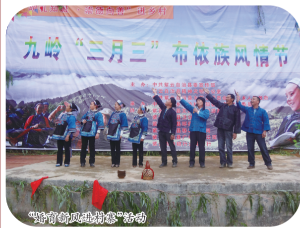
“婚育新风进万家”活动