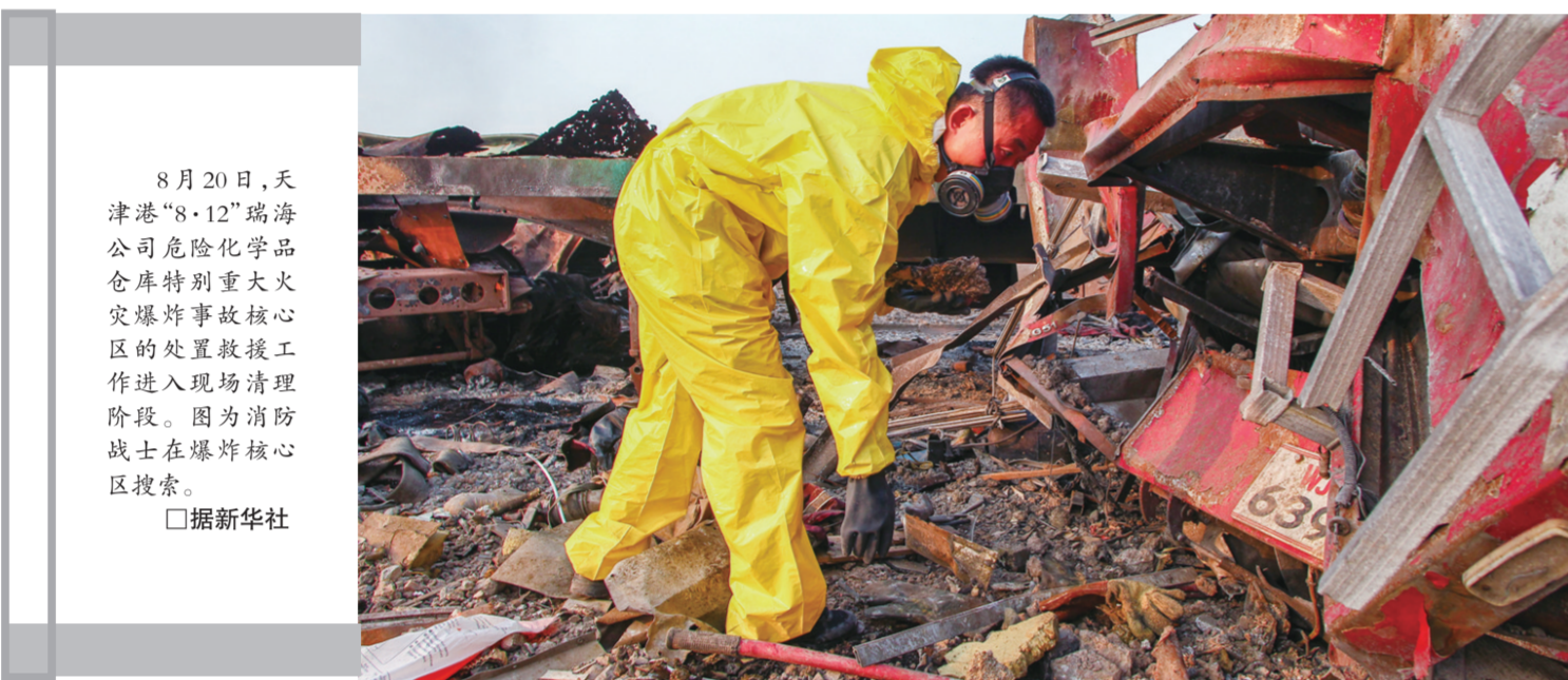
8月20日,天津港“8·12”瑞海公司危险化学品仓库特别重大火灾爆炸事故核心区,消防战士在爆炸核心区搜索。

由此可见,审美教育在语文教学中有着非常重要的作用,是不应该被忽视的。语文教学呼唤审美教育的参与。真希望我们的语文教学能让师生都感到快乐,都觉得是一种美的享受。这并不是梦,它是一定能实现的,只要我们都来重视并实施审美教育,更何况有些语文教师已经在这么做了。