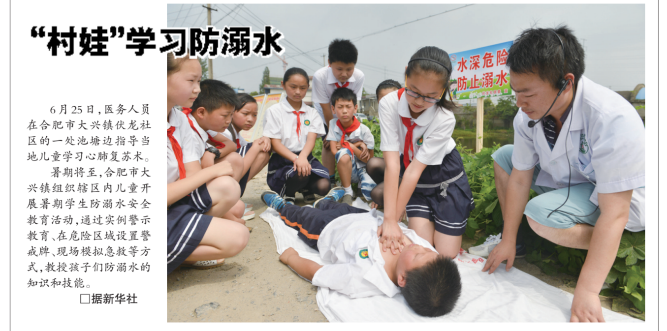
“村娃”学习防溺水知识。6月25日,医务人员到合肥市大兴镇伏龙社区的一处池塘边指导当地儿童学习心肺复苏术。

暑期将至,合肥市大兴镇组织辖区内儿童开展暑期防溺水安全教育活动,通过实例警示教育、在危险区域设置警戒牌、现场模拟急救等方式,教授孩子们防溺水的知识和技能。