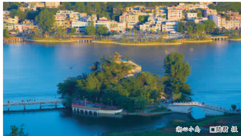
湖心小岛

以山体绿化为特色,打造生态风景园林。城市绿化从孤立强调人为景观向风景园林生态景观转变,确立了“森林围城、城中有林”的建设思路。年初,投入资金 80 万元,对安顺的