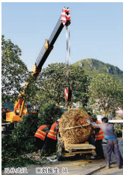
园林建设

一方面以“专家参与”为切入点,通过走出去、请进来,学习先进城市创建园林城市工作的成功经验,邀请有关专家对创园工作进行调研、提出意见和建议,进一步明确创园工作的重点和方向,为制订切实可行的创园工作方案奠定坚实的基础。另一方面认真开展城市绿地系统建设相关课题的研究,按照充分利用自然山水、传承历史文脉、展示现代文明的要求,加快《安顺市城市绿地系统规划》和《安顺市绿地管理办法》等的编制工作,为城市绿地系统建设提供科学依据。