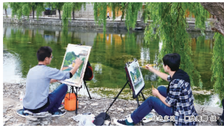
绿色家园

充分利用自然资源优势,启动“显山露水”工程。以沿山、沿河、沿湖公园绿地建设为重点,以满足市民休闲游憩需要为目标,完成电视塔、鸵宝山山体、黄果树大街两侧山体绿化规划及建设;贵城河河道绿化一期工程(龙泉路段);虹山湖周边山体公园建设。