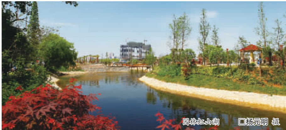
园林虹山湖

以城市道路为主线,建设生态景观长廊。一年来,投入资金 1.1 亿元,高标准、高质量完成了黄果树大街、迎宾路、机场路、北郊路、北航路、中华东西路等 10 余条城市主要干道的绿化建设,绿化里程 50 多公里,城市道路绿化网络初具雏形。在树种配