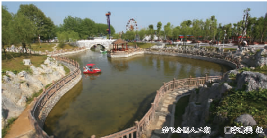
若飞公园人工湖 □李奇美 摄

通过广场、亲水平台、人工岛、木栈道、风筝广场等沿湖景观建设,合理地对湖区淤积和驳岸进行改造,重点打造绿化和夜间灯光系统,总规划面积 134.26 公顷,投资 8000 万元的虹山湖景观整治有效地改造了湖岸景观。2012 年 11 月初,整治后的虹山湖景观全面开放,呈现给市民一条绿色、美丽、舒适滨水绿色长廊。