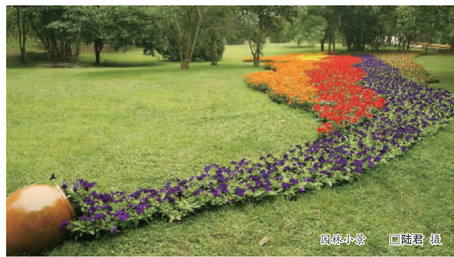
园林小景

美丽的城市,离不开鲜花的点缀,喜庆的日子里,更是需要花儿的衬托。在五一、七一、国庆等特殊的日子,在城区主要节点、广场,一盆盆精心布置的鲜花,美化、提升了环境,将节日烘托得更加喜庆、祥和。