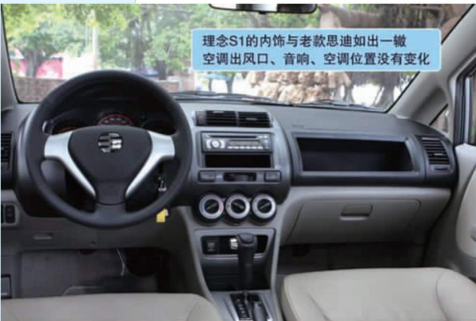
理念S1的内饰与老款思迪如出一辙 空调出风口、音响、空调位置没有变化

车型点评:难道说理念S1就是专为中国人打造的思迪?虽然外观有所小改动,但依旧显得比较中庸。内饰设计也显得比较朴实,不过实用性特别强。平稳的动力谈不上驾驶乐趣,但对于家庭用户来说也完全足够,加上较大的内部空间和后备箱,非常适合家庭用户的需求。