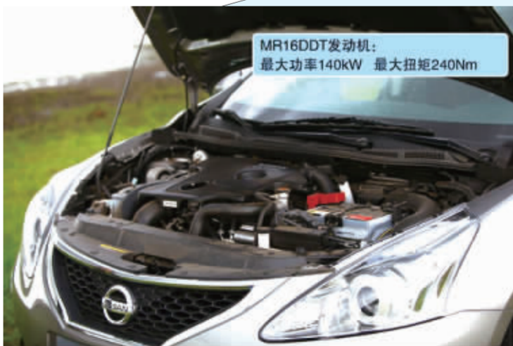
MR16DDT发动机: 最大功率140kW 最大扭矩240Nm

新一代骐达搭载1.6T涡轮增压汽油直喷发动机,可以输出最大140千瓦的功率,最大扭矩高达240牛米。与之配备的是6速手动和6速CVT变速器。看来东风日产引进了一款十分强大的心脏,让新骐达这款家用小车瞬间变成国内又一款备受瞩目的小钢炮。