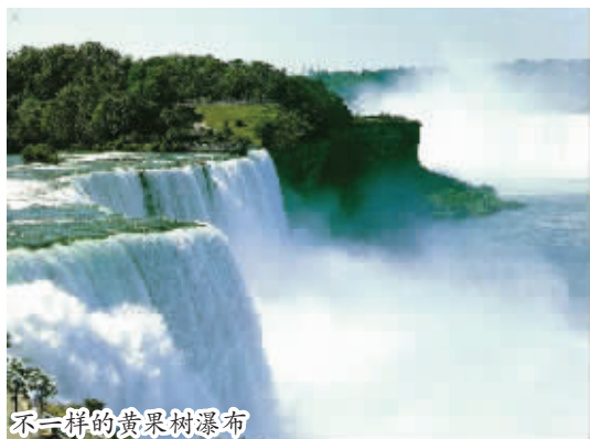
不一样的黄果树瀑布

关岭县花江镇,再从花江镇乘小面包车,5元,往西行2公里即可到大峡谷景区,这一段也可乘坐三轮车。自驾可沿黄贵公路、关兴公路至花江,路程约3个小时。