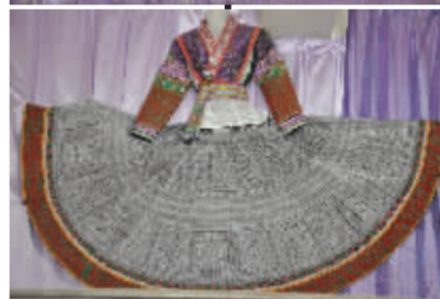
艺术精品丰富 多彩