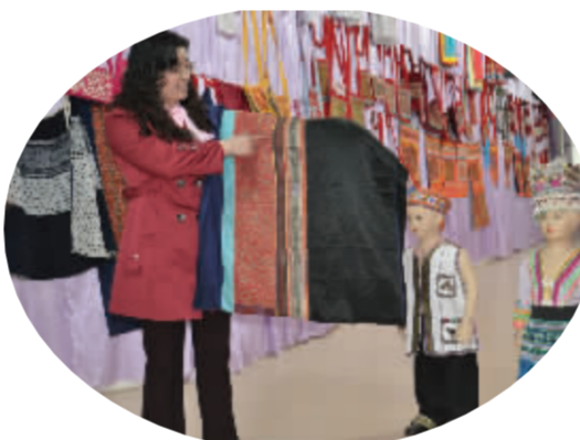
上万元的手工极品刺绣展示