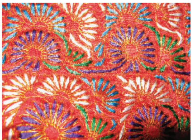
部分手工机织绣品展示