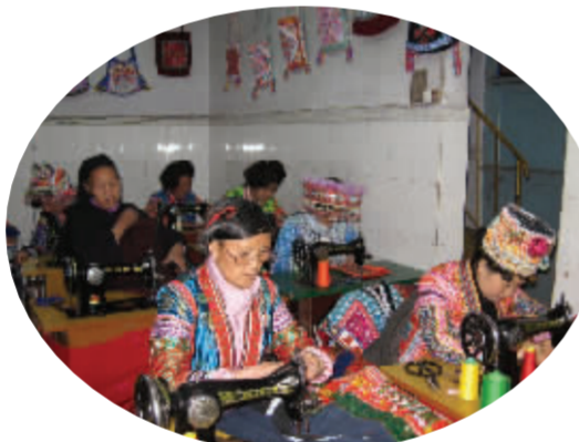
民族艺术源自民间传承