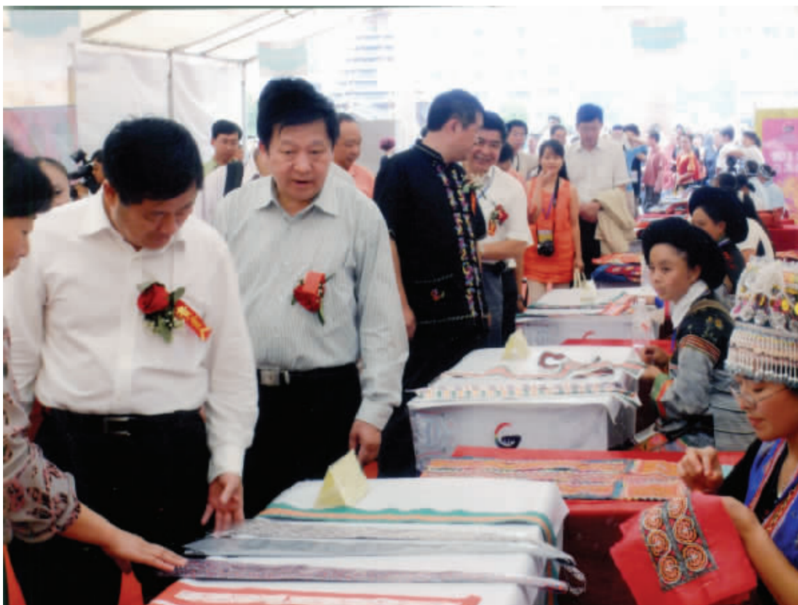
2008年12月7日省委副书记王富玉在全省举办的多彩贵州旅游商品“两赛一会”能工巧匠选拔大赛现场会上参观“蒙固祯”民族服装厂的手工刺绣商品