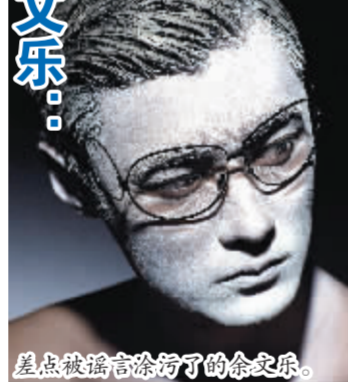
差点被谣言抹杀了的余文乐。

据香港某周刊爆料,香港一名一线男星感染艾滋病。周刊以“Y男星”作代指,并提示了“Y男星”具备“外形俊朗,身材健硕”“爱泡夜店”“电视圈稳坐一线小生位置”“在电影圈抢手”“演而优则唱”等7项特征。消息一经爆出,不少媒体与网友纷纷进行比对,香港男星余文乐、古天乐、林峰等都陷入风波。其中,由于余文乐的姓氏字母中有“Y”,所以成为了最易怀疑的对象。