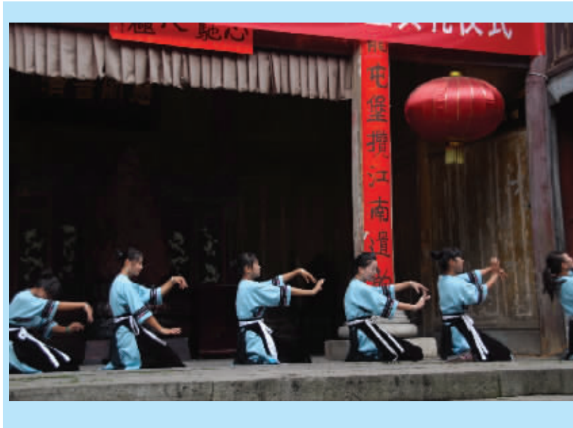
贵州省旅游学校“屯堡旅游班”经过三年的学习,毕业典礼仪式于7月26日在天龙屯堡举行。该班共有43人,毕业后全部进入天龙旅游公司,使该旅游公司整体素质得到进一步提高。图为毕业典礼上学员们表演自己创作的节目。